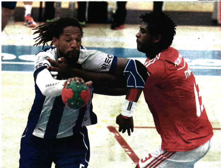
FC Porto e Benfica protagonizaram um jogo rico em qualidade individual e coletiva e equilibrado até ao fim

A partir daqui o jogo tornou-se ainda mais emocionante e foi Hugo Santos a fazer o 14-13 e Quintana segurar a vantagem mínima ao intervalo. Sol de pou-