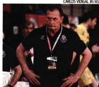
CARLOS VIDIGAL JR/ASF

«Esperamos jogos muito equilibrados, que serão resolvidos nos pormenores, como foi na Taça. Mas estamos cientes do nosso objetivo, pelo que vamos fazer tudo para voltar às vitórias e, jogando em casa, esperamos casa cheia», dis-