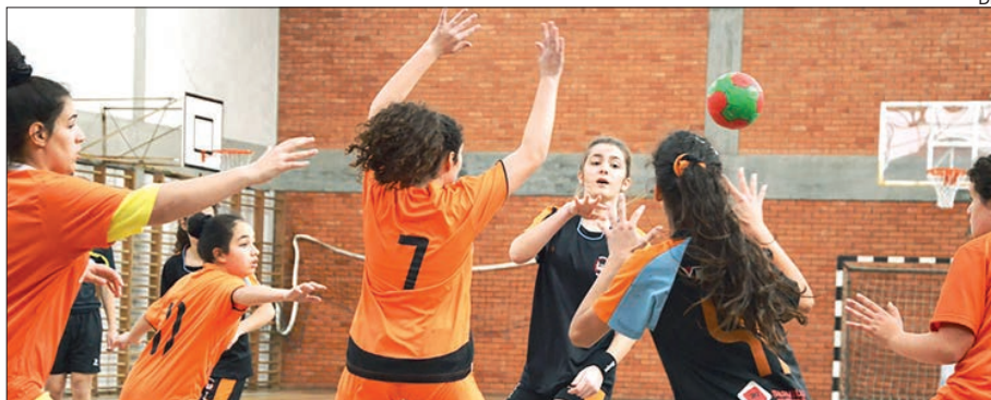
Um pormenor de um dos encontros

O Centro Social da Juventude de Mar esteve em destaque no 12.º Torneio de andebol feminino Prof. Manuel Ribeiro disputado em Esposende, ao vencer em infantis e iniciadas.