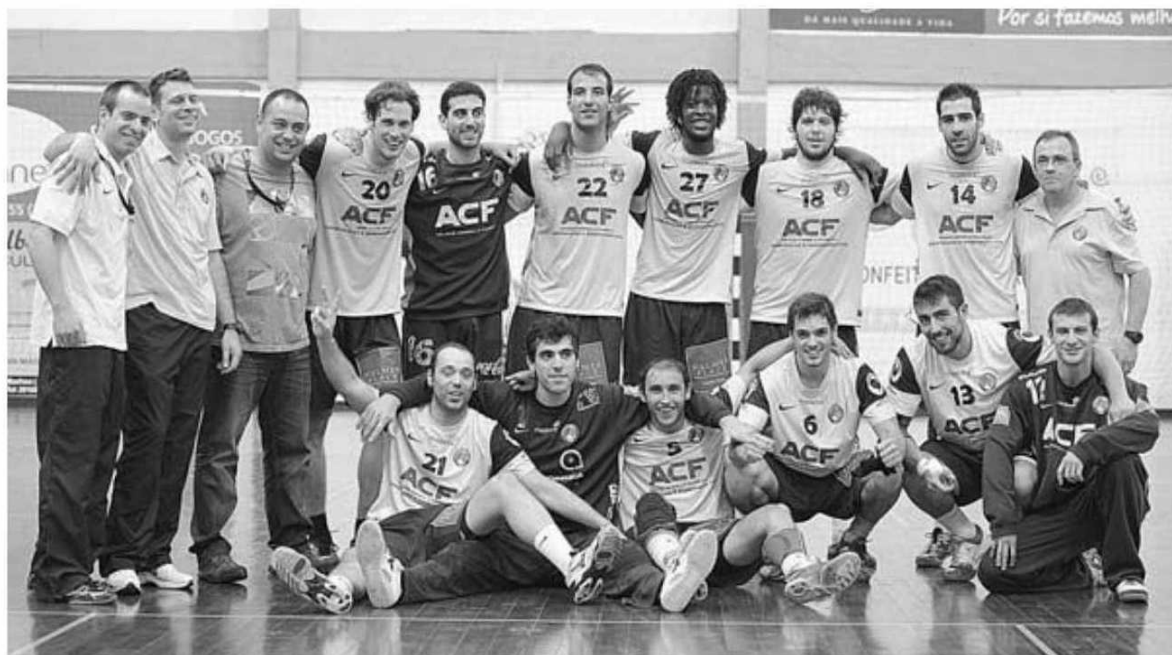
Mesmo com a época finda, Madeira SAD continua a trabalhar para decidir futuro do projecto.