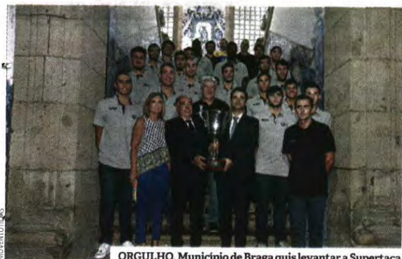
ORGULHO. Município de Braga quis levantar a Supertaça

Guilherme Freitas pediu apoios face às dificuldades financeiras, que levaram o clube a abdicar das provas europeias: "Precisamos de um reforço do contrato-programa para colocarmos as contas em dia. E precisamos de melhores condições. O ABC já não precisa de uma academia, mas sim de uma universidade de andebol." ● P.G.S.