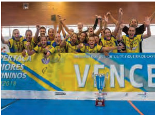
Madeirenses bateram o Colégio de Gaia por 21-16