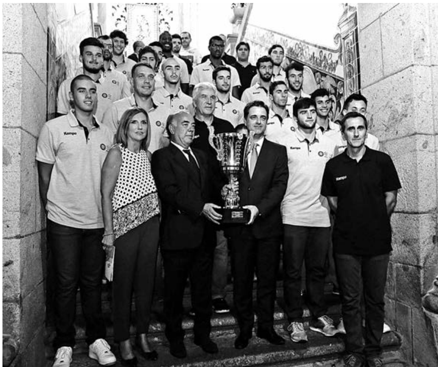
Equipa profundamente renovada do ABC/UMinho, que conquistou a Supertaça, recebida na Câmara Municipal de Braga

Assim, prosseguiu, esta vitória tem uma dupla dimensão, pois representa ainda a aposta ganha