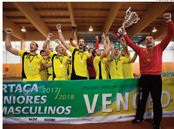
Minhotos superaram o Sporting por 26-21