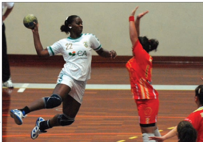
João de Barros pode ter a companhia da Juve na Europa

No entanto, o regulamento da Federação de Andebol de Portugal (FAP) apenas define quatro vagas nas competições europeias, três delas a serem preenchidas através do Campeonato Nacio-