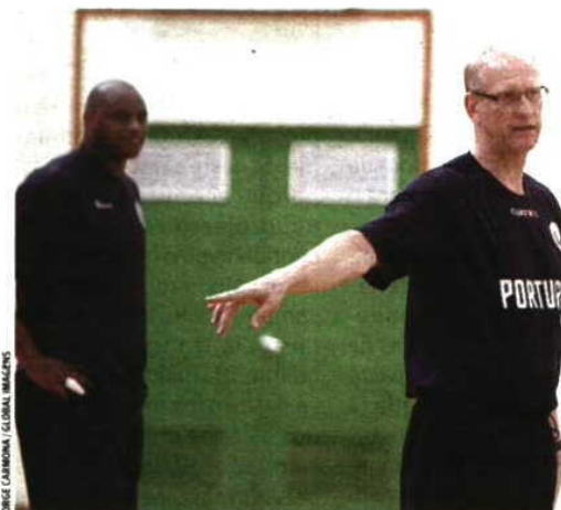
Prontos Olsson diz que Portugal vai discutir a passagem

A comitiva nacional parte esta manhã para Espanha e, ao final da tarde, fará o primeiro treino no novo Pavilhão de Guadalajara. ■