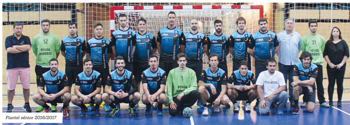
Plantel sénior 2016/2017

Antes da competição oficial, a ter início em outubro, os seniores do Póvoa Andebol vão realizar durante o mês de setembro dois jogos de preparação.