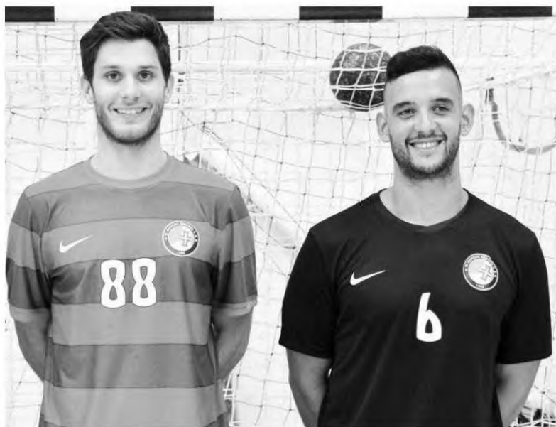
Aí estão os novos equipamentos do Madeira SAD.

Ora, muitos dos amantes da modalidade sentem-se traídos com esta decisão, que promete dar que falar. Até os governantes ficaram