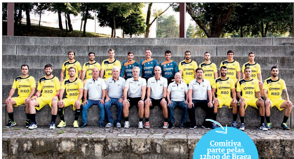
ABC/UMinho parte, hoje, rumo a terras austríacas

Comitiva parte pelas 12h00 de Braga e chega à Áustria às 18h30 (hora de Lisboa).