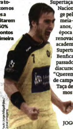
Paulo Jorge Magalhães / Global Images