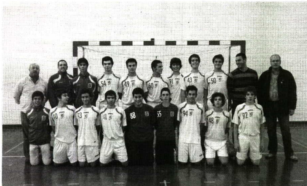
A equipa do Cister venceu o título regional de juvenis contra a equipa Dom Fuas, da Nazaré

O Cister Sport de Alcobaça garantiu a conquista do título regional de juvenis masculinos de andebol ao bater, na final, o rival Dom Fuas da Nazaré por claros 43-29. Num "derby" com muita intensidade e com pavilhão bas-