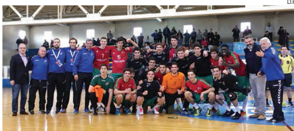
Selecção Nacional a festejar a conquista no "Quadrangular"

O torneio, que reuniu, ainda, as congéneres da Tunísia e da Roménia e que também teve dois jogos que se disputaram em São João da Madeira, foi organizado com o objectivo de ser mais uma etapa de preparação da Selecção Nacional tendo em