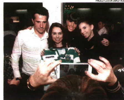
O treinador alvo das atenções das adeptas sportinguistas