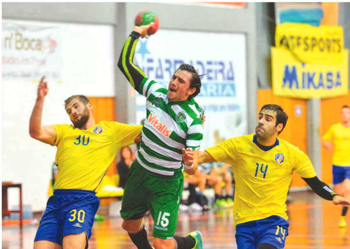
Sporting veio à Região bater o Madeira SAD.