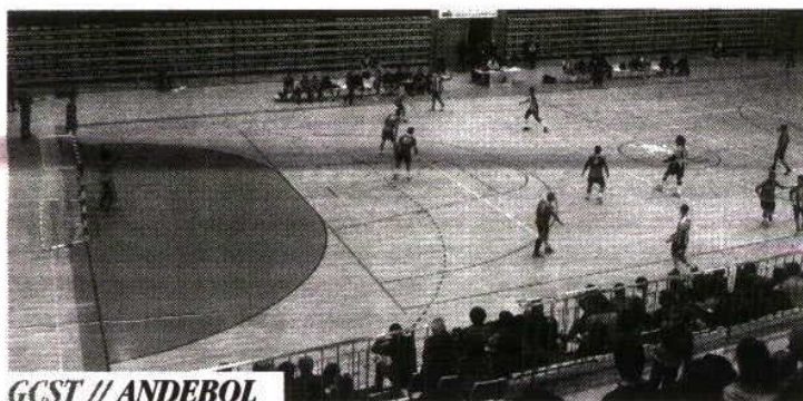
GCST // ANDEBOL