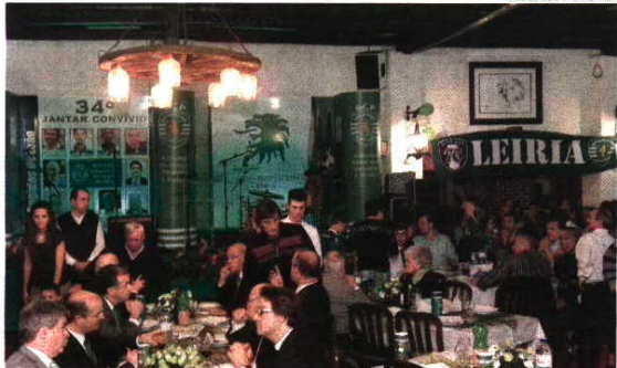
Festa teve 1200 leões a rugir bem alto