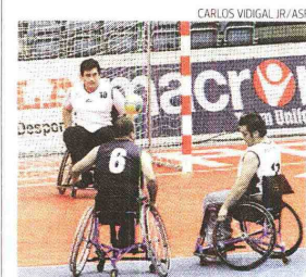
Exibição de cadeira de rodas em Portimão

→ Projecto do andebol nas prisões e em cadeira de rodas em debate em Viseu