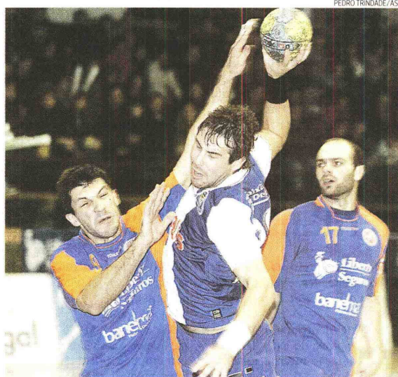
Partida entre FC Porto e São Bernardo anima Torneio de Tarouca