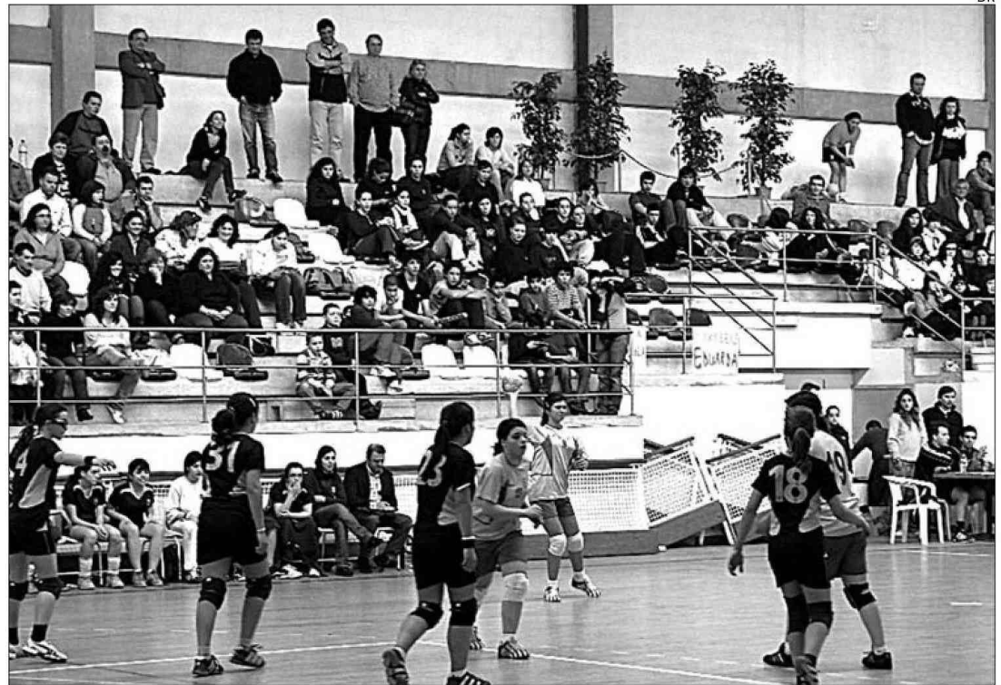
Andebol feminino tem forte implantação em Esposende

multaneamente no dia 13, pelas 11h00, no Pavilhão da Escola António Correia de Oliveira e no Pavilhão de Mar, estando as finais marcadas para o dia 15, às 14h30, no Pavilhão de Mar.