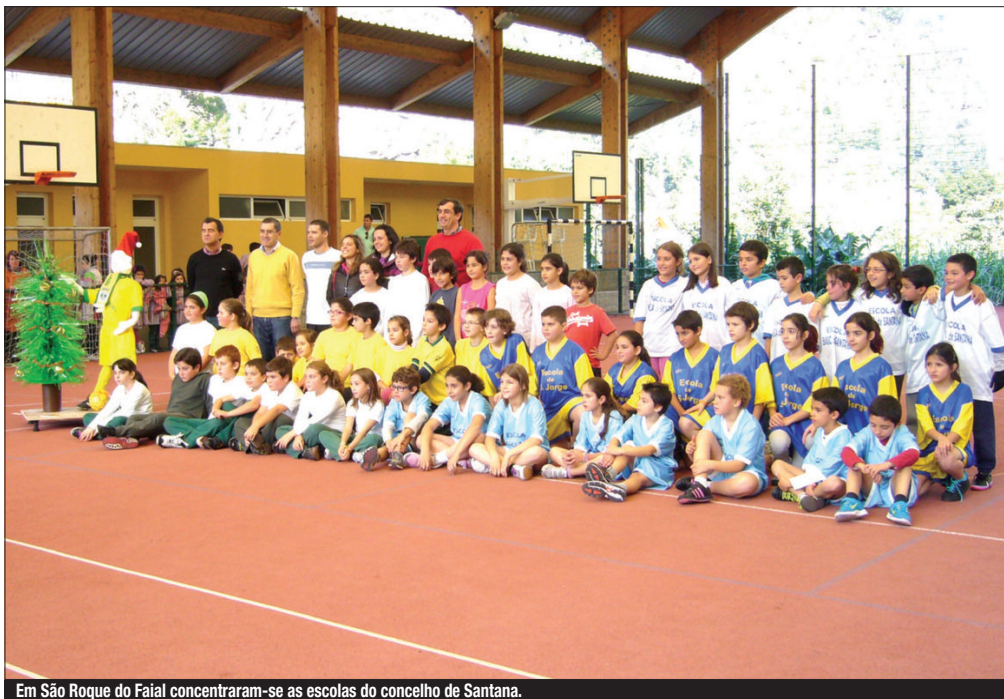
Em São Roque do Faial concentraram-se as escolas do concelho de Santana.