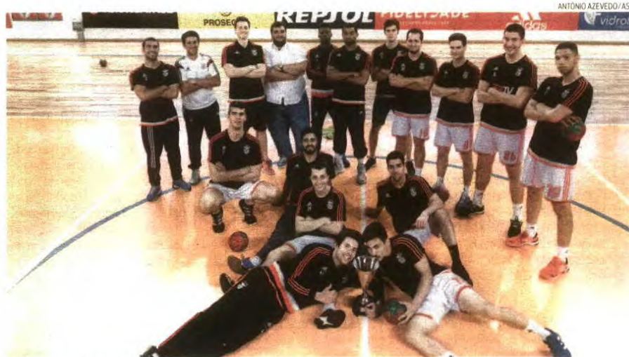
Equipa júnior masculina do Benfica sagrou-se campeã nacional em 2015/16 sem qualquer derrota

Certo é que nem tudo foi fácil para o grupo. «Trabalhámos muito. Tivemos a facilidade da época não ter sido muito difícil até à fase final e podermos preparar-nos com o objetivo de chegar a essa etapa nas melhores condições. Isso fez a diferença. Tínhamos menos ritmo competitivo, mas mais qualidade coletiva. O grupo estava coeso e jogámos a um ritmo de jogo muito superior a qualquer outra equipa», explicou o treinador.