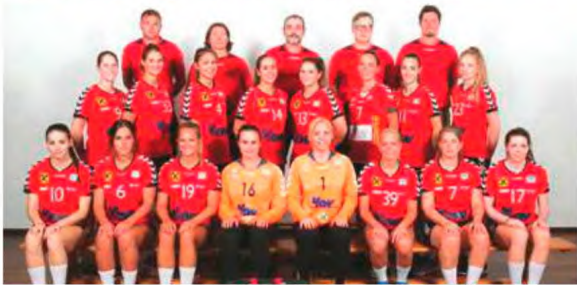
Brest defronta Madeira SAD e SSV Dornbirn Schoren o CS Madeira.