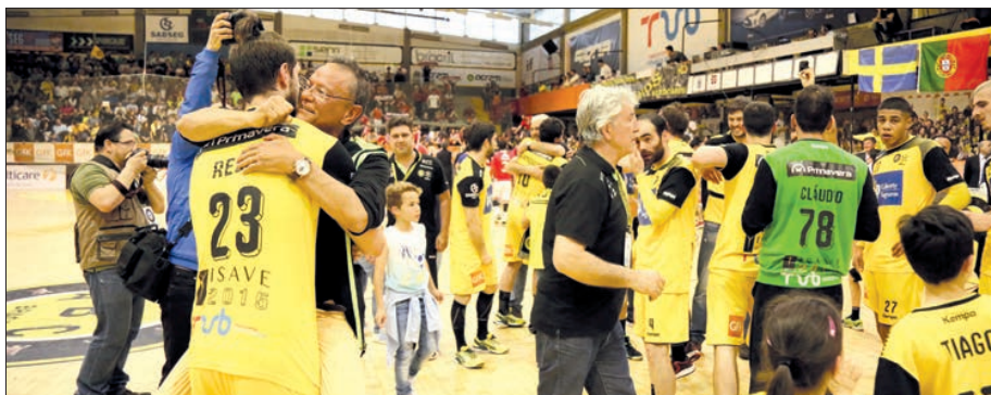
ABC/UMinho espera jogar Liga dos Campeões... a dois passos do Sá Leite