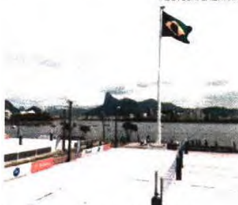
Brasil representado por 462 atletas