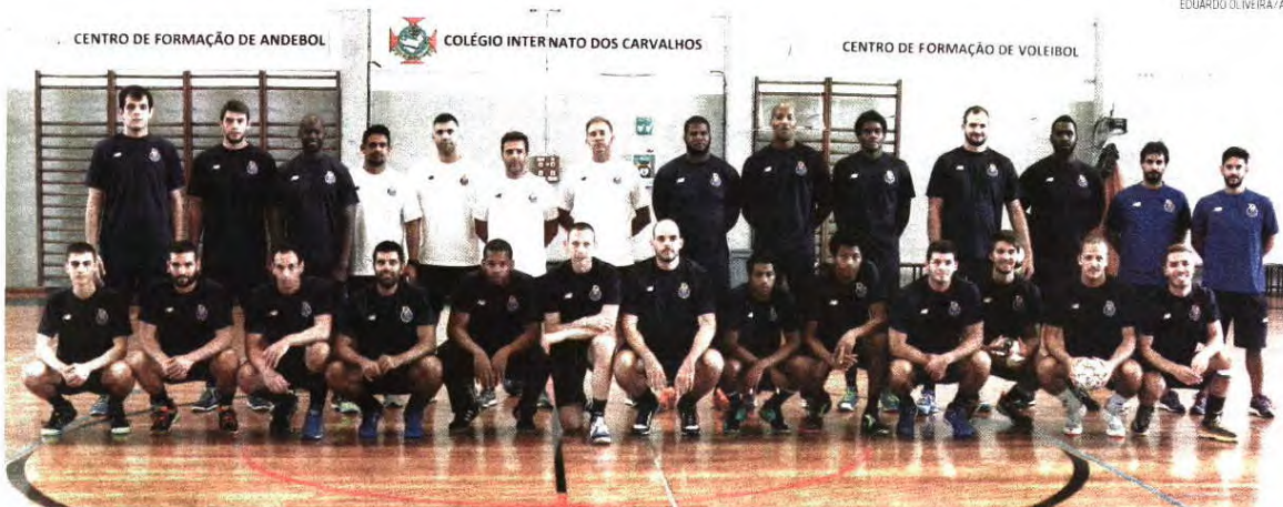
O plantel do FC Porto segue para o estádio em S. Pedro Sul, onde vai começar a preparar a nova época e a integração dos oito atletas estrangeiros que chegaram ao Dragão

◉ Campeonato é o grande objetivo para 2017 ◉ Ausência de Gilberto Duarte notada