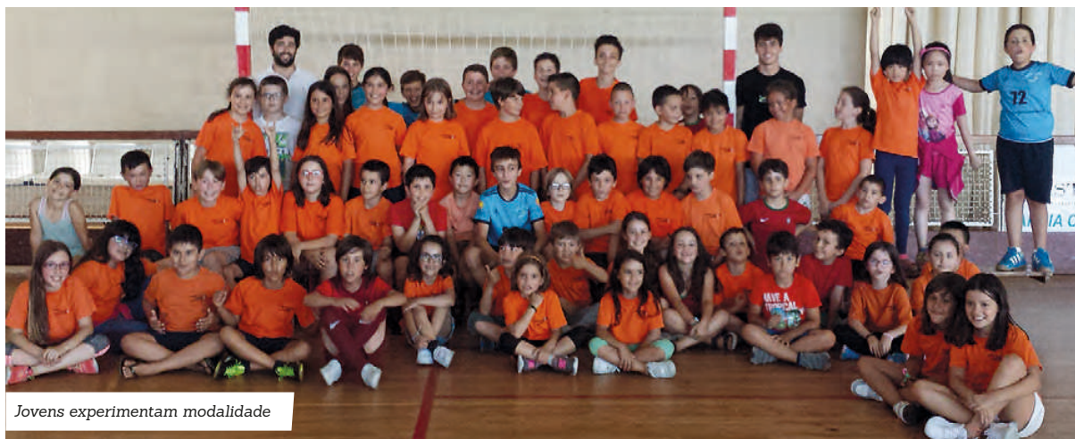
Jovens experimentam modalidade

tugal e uma modalidade que já teve uma equipa poveira na primeira divisão", revelou o clube que agora regressa aos trabalhos a 1 de setembro no arranque da próxima época.