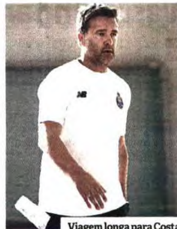
Viagem longa para Costa

Bretagne e o Nantes Loire Atlantique. Na Taça Challenge, é o Sports Madeira a primeira equipa portuguesa a entrar em competição, frente à formação austríaca do SSV Dornbirn Schoren, nos dias 15/16 e 23/24 de outubro. O Colégio de Gaia, apurado para a ronda seguinte, irá defrontar, a 12/13 e 19/20 de novembro, o vencedor do jogo entre as espanholas do Helvetia Alcobendas e as macedónias do ZRK Kumanovo. I.C.