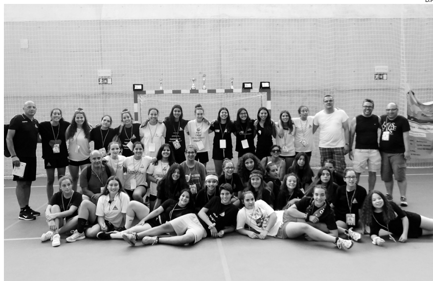
Comitiva da AAE que marcou presença no Torneio Terras de Lafões, em Oliveira de Frades

No segundo dia, de manhã cedo, foi a vez das Iniciadas enfrentarem o Arsenal Canelas, arrecadando a segunda derrota, ao perderem por 8-12, desfecho igual ao da equipa de juvenis,