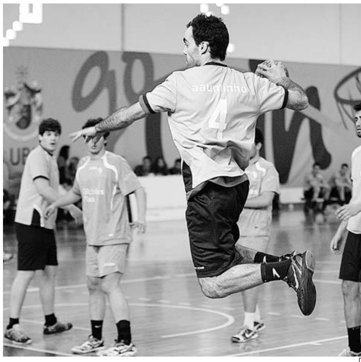
Equipa minhota continua a demonstrar toda a sua qualidade e hegemonia no andebol universitário