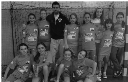
Infantis femininas empatam 17-17