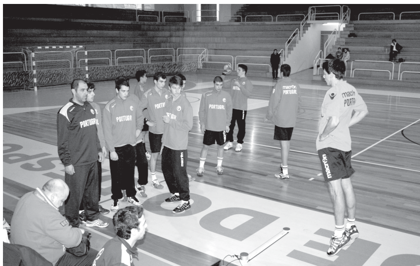
■ Os portugueses também já preparam em Rio Maior o apuramento para o Campeonato da Europa de 2014 na Polónia.