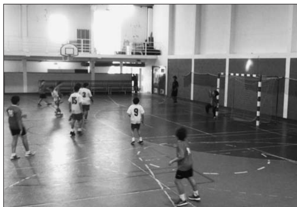
Torres Novas / CA Salvaterra Magos (Esc. Artur Gonçalves)

Domingo 23-11-2013 pelas 16,00h, comparece para apoiares a tua equipa.