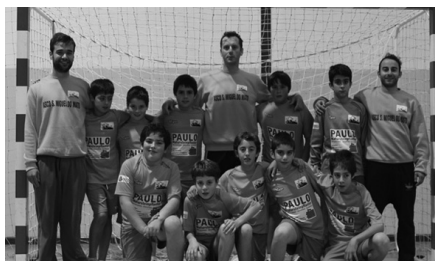
Infantis masculinos vencem 16-14

No passado sábado, dia 16 de Novembro, disputou-se uma dupla jornada de andebol no Pavilhão Municipal de Vouzela, as duas equipas de infantis da Associação S. Miguel do Mato.