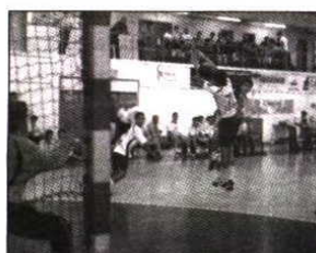
Iniciados do Belenenses ganham ao Ginásio

PRÓXIMA JORNADA (20-03-2011): Ginásio Sul - Sporting (Pavilhão do Casal Vistoso, 15 horas); Belenenses - Passos Manuel (Pavilhão Acácio Rosa, 12 horas); Benfica - Almada (Pavilhão N.º 2 - Luz, 12 horas). Folga o Lagoa.