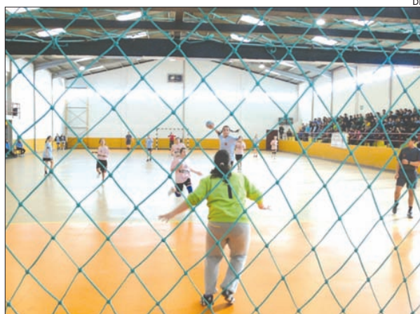
Um pormenor de um dos encontros

O Maia Stars foi também o primeiro classificado em iniciados, seguido do Clube de Andebol de Leça (CALE) e do Clube de Andebol de São Fé-