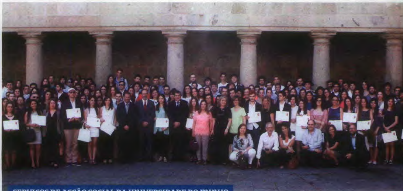
SERVIÇOS DE ACÇÃO SOCIAL DA UNIVERSIDADE DO MINHO