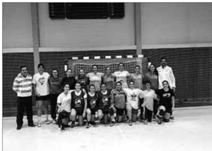
Técnico nacional assistiu a treino da equipa sénior feminina

No dia 20 terá início a fase final da competição. Serão 10 jornadas de muita luta entre seis equipas muito niveladas e onde todas partem com legítimas aspirações a alcançar um dos dois lugares de subida à 1ª divisão. Na 1ª jornada, a equipa marinhense recebe o Vela de Tavira. Os outros jogos da jornada inaugural serão Modicus Sandim - Académico do Porto, Ílhavo - Vale Grande (Odivelas) e Valongo do Vouga - Juventude Mar (Esposende).