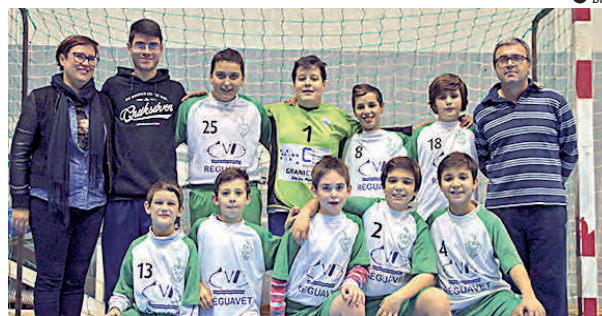
● Equipa Minis Bambis

No domingo, das 10h00 às 11h30 - Pavilhão Municipal de Peso da Régua: CCR Fermentões "A" - BECA "A"; AD Godim - CCR Fermentões "A"; BECA "A" - AD Godim.