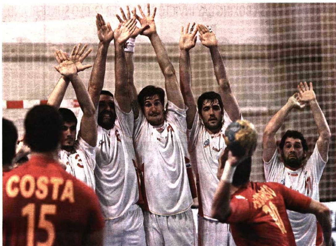
MURALHA. Equipa das quinas pôs este ano nuestros hermanos em sentido durante o playoff do Mundial

“Para além do duplo confronto com a Espanha, teremos mais dois jogos, depois do Ano Novo, frente à Austria e outros tantos contra a República Checa. Já já contaremos com os jogadores do Benfica, que também irão ter uma boa experiência internacional na Holanda. Vamos fazer experiências e introduzir ideias novas nestas duas semanas de testes. Será a nossa pré-época, tendo em vista a preparação para os jogos oficiais”, sus-