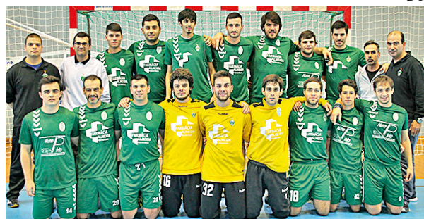
● EQUIPA SENIORES MASCULINOS

Às 17h15, BECA "A" - AD Godim. Às 18h00, jogo entre CD Xico Andebol - BECA "A".