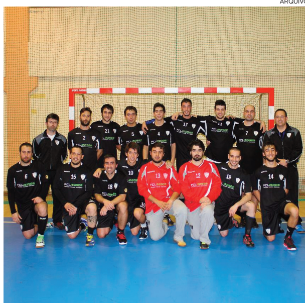
Equipa treinada por Marco Rodrigues termina na 5.ª posição

Já o Académico de Viseu, orientado por Marco Rodrigues, manteve a quinta posição na tabela classificativa e, curiosamente, sem qualquer