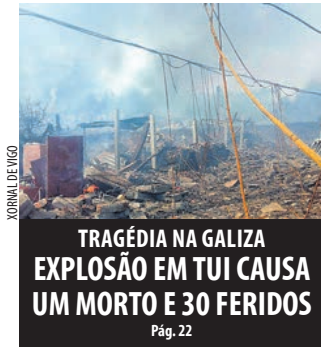
TRAGÉDIA NA GALIZA EXPLOÇÃO EM TUI CAUSA UM MORTO E 30 FERIDOS Pág. 22