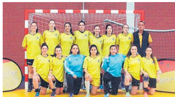
Equipa de andebol feminino da Escola Secundária Carlos Amarante

comunicado os responsáveis pela equipa da ESCA destacam a excelente organização do evento, dando ainda conta que no segundo dia depois das competições houve uma festa convívio. E terminou no terceiro dia após as competições e as respectivas cerimónias de entrega de prémios com um almoço no multiusos entre todas as comitativas presentes. Colaboram no evento 285 alunos voluntários e 222 elementos da organização de todo o país e da Madeira.