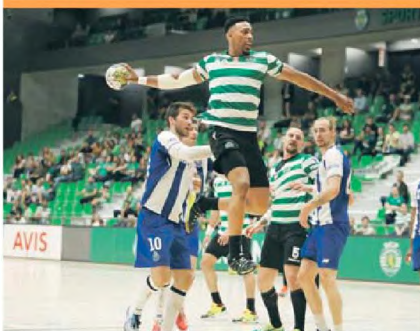
Sporting joga final antecipada com FC Porto no sábado de olho na conquista da 16.ª Taça