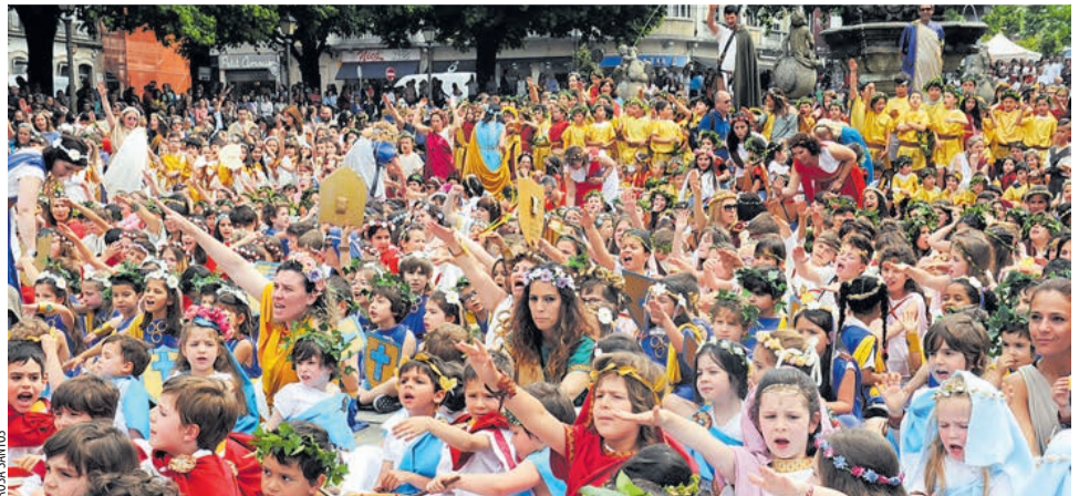
MILHARES DE CRIANÇAS E JOVENS DAS ESCOLAS DO CONCELHO INVADIRAM CENTRO HISTÓRICO PARA O INÍCIO DO ESPECTÁCULO