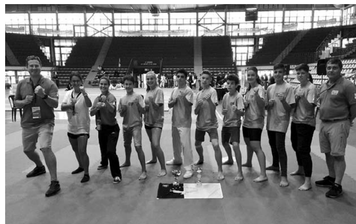
KARATÉ com ótimo desempenho nos Jogos efetuados na Sicília

DIA 26 DE MAIO. Futebol. Açores 2 – Córsega 6. Classificação geral