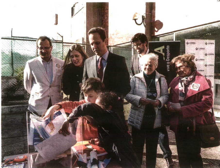
Numa caixa/cápsula do tempo, para abrir ninguém sabe quando no futuro, as crianças, cujos olhos brilhavam, depositaram desenhos