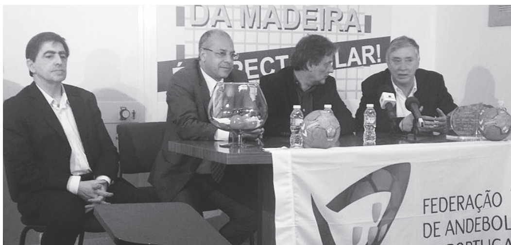
O sorteio foi realizado na tarde de ontem, na sede da Associação de Andebol da Madeira.

Sorteio ditou que as meias-finais sejam disputadas com as partidas: CS Madeira-Juve Lis e Colégio de Gaia/Toyota-Madeira SAD.