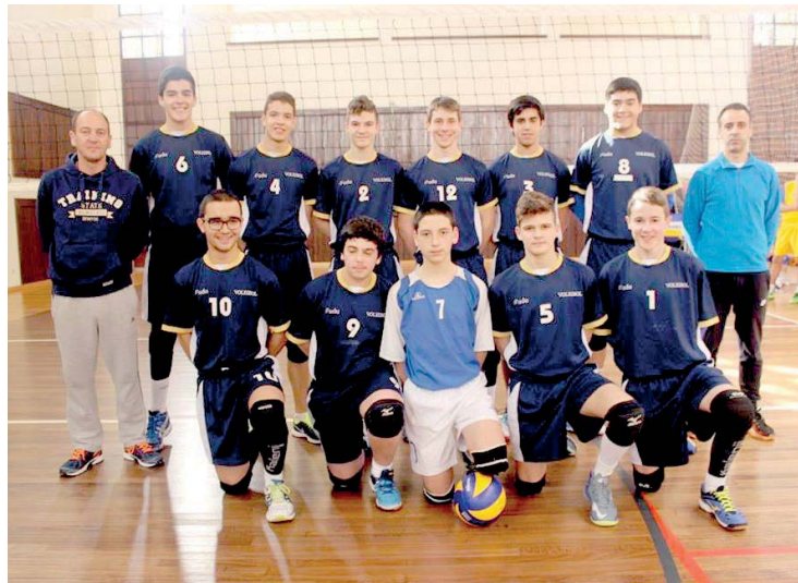
A selecção de voleibol dos Açores que vai estar nos Jogos das Ilhas de Maiorca

O líder da associação micalense recordou que uma situação semelhante aconteceu no ano passado, nos Jogos das Ilhas que tiveram lugar na ilha Terceira. “Nas vésperas dos ‘Jogos’ algumas selecções desistiram de participar com