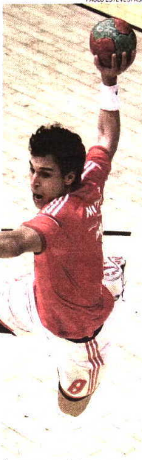
Última presença foi há sete anos

«Fiquei um pouco surpreendido porque deveu-se ao infortúnio do Fábio Vidrago [lesão no pé do ponta-esquerda do ABC], mas, acima de tudo, feliz por poder fazer parte das escolhas do