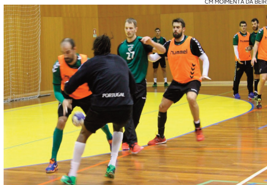
CM MOIMENTA DA BEIRA

Jogadores realizaram o primeiro treino no Pavilhão Municipal