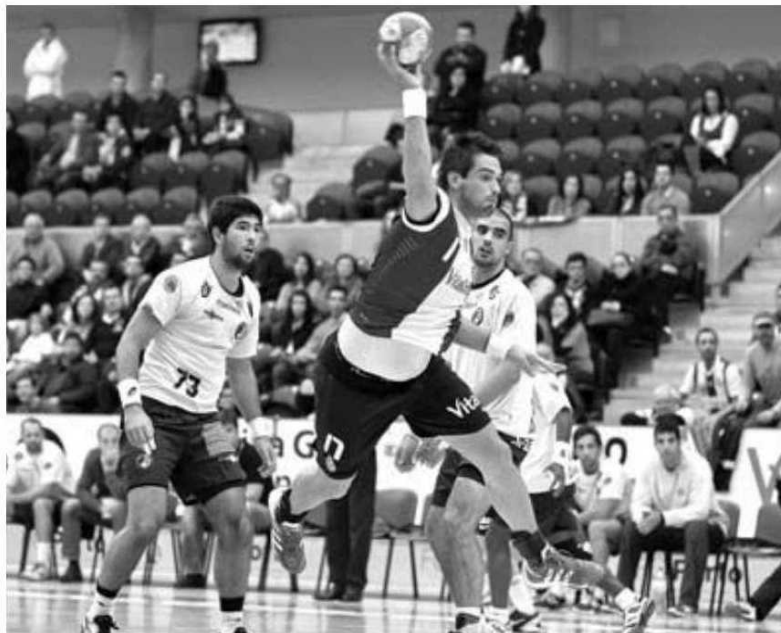
SAD joga tudo esta tarde frente ao Porto.

Na II Divisão, o Marítimo cumpre uma dupla ronda no continente. Hoje pelas 17 horas actuam na margem Sul frente ao Ginásio do Sul. Amanhã às 15 horas os verde-rubros defrontam o Sismaria. Os madeirenses reúnem fortes possibilidades de atingirem a fase final pelo que pontuar fora será uma forma de consolidar essa meta.