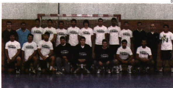
A equipa de Avanca promete dar tudo na recepção ao Benfica, esta tarde