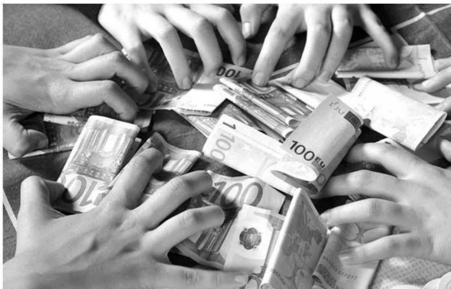
O 'dinheiro vivo' tarda em entrar nas contas dos clubes.

Apesar de não estar a pagar o que já está contratualizado, o Governo Regional continua a autorizar a celebração de contratos-programa