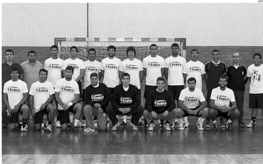
ARTÍSTICA conheceu bem o valor do Benfica, nos jogos de preparação no Sabugal e da primeira volta