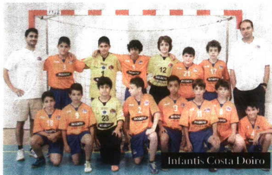
Infantis Costa Doiro

Lagos preserva a tradição no fomento do andebol e mantém a chama acesa nos quadros competitivos regionais e nacionais, mormente nos escalões de formação. Não obstante ter "abandonado temporariamente" a promoção do escalão sénior, tanto em masculinos como femininos.