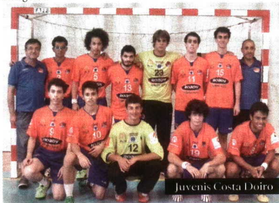
Juvenis Costa Doiro

No Torneio de Abertura apenas com 2 equipas, o Costa Doiro foi batido pelo CDC Albufeira. Já na 1ª Fase do Campeonato Nacional, ficou em 2º lugar, apenas a 1 ponto do CCP Serpa, mas na 2ª fase, quedou-se pelo 8º lugar entre equipas de outro gabarito, tais como Vitória de Setúbal, Benfica B, Almada, CDC Camões. Contudo, fica um sinal positivo.