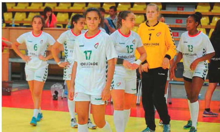
Portugal luta agora por um lugar entre o nono e o 16.º no Europeu.

Hoje a equipa portuguesa volta a estar em acção, desta feita de-frentando a formação da Noruega, que lidera o grupo I2 desta fase intermédia com quatro pontos, contra nenhuns da seleção lusa.