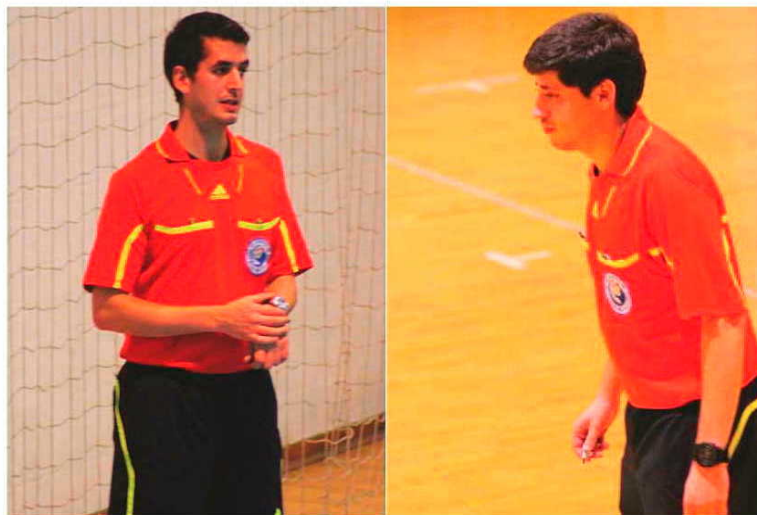
Gonçalo Aveiro e Hugo Fernandes irão apitar o FC Porto - ABC.