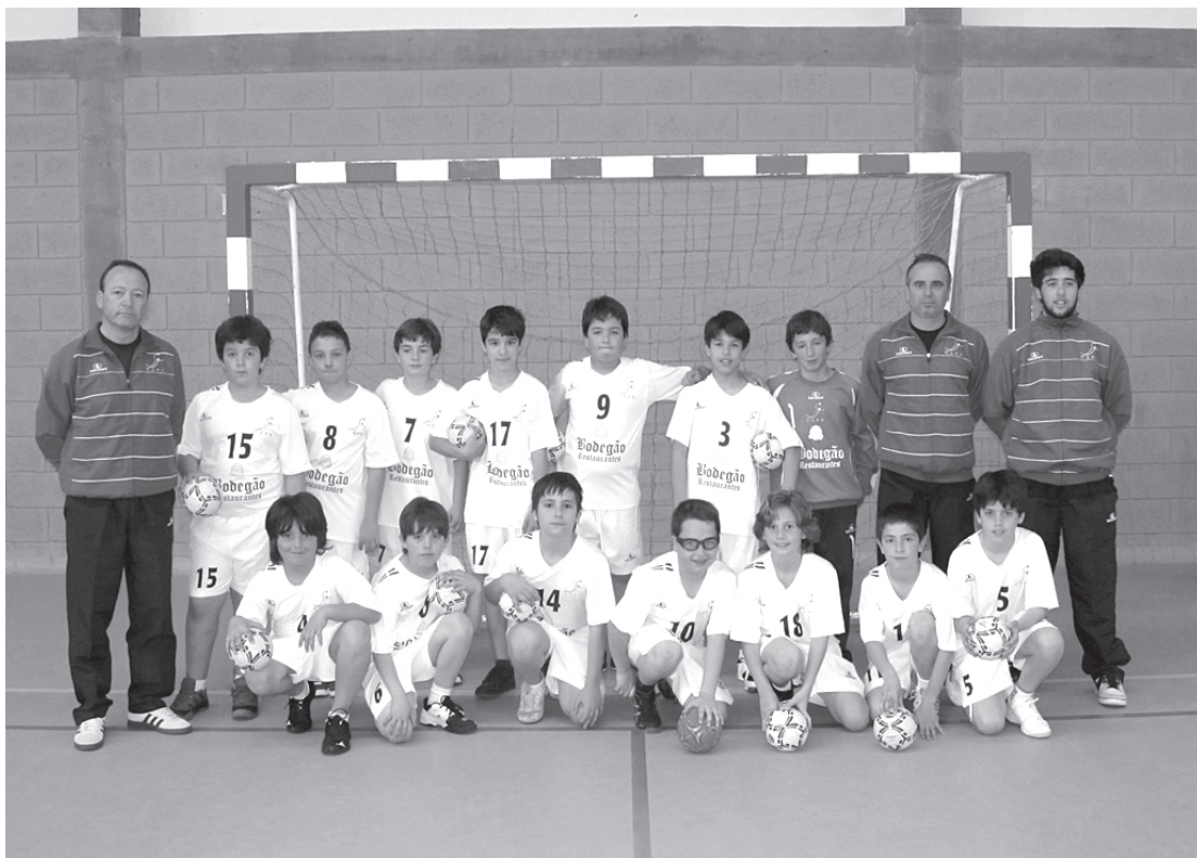
Minis do CAPV somam quatro vitórias e apenas sofreram uma derrota na época de arranque

Os iniciados bateram o Salgueiros (36x25) na sexta jornada da Taça Primavera e são segundos (13 pontos). No próximo sábado (15h00) recebem o Macieira.