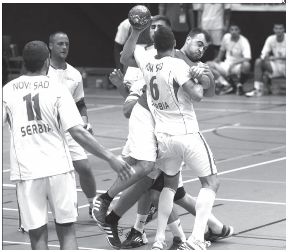
Andebolistas minhotos em ação, no jogo de ontem

O andebol da Universidade do Minho sofreu ontem a sua primeira derrota na competição ao perder por 24-21 frente à Universidade de Novi Sad (Sérvia). A defesa muito forte dos sérvios fez a diferença, mas os minhotos claudicaram na finalização, so-