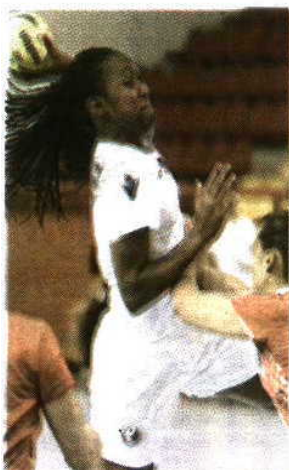
Ataque > Funcionou pouco