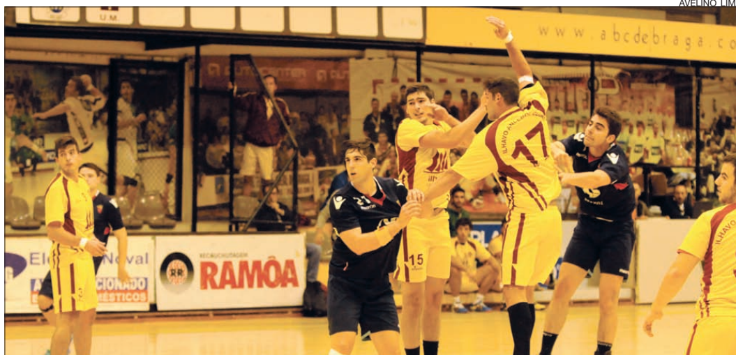
A equipa do Arsenal da Devesa mostrou total superioridade em todos os capítulos do jogo