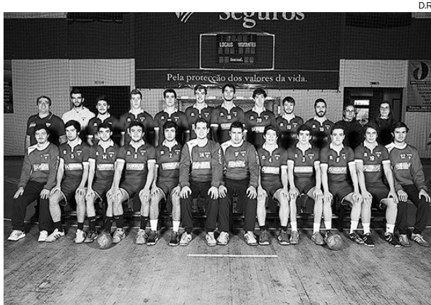
Juniores do São Bernardo defendem o primeiro lugar em Lisboa

Habitados, neste escalão, a jogar na Zona Norte, os avei- renses, treinados pelo experiente Litos, estão a surpreender e seguem em primeiro lugar com apenas um empate consentido, tendo já ganho, por exemplo, a Sporting e a Bele-