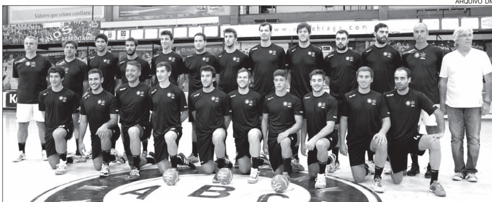
ABC passou no teste de Belém

O ABC/UMinho venceu ontem o Belenenses, por 31-22, no pavilhão Acácio Rosa, em Belém, e ascendeu de forma provisória ao terceiro lugar do campeonato nacional da I Divisão.