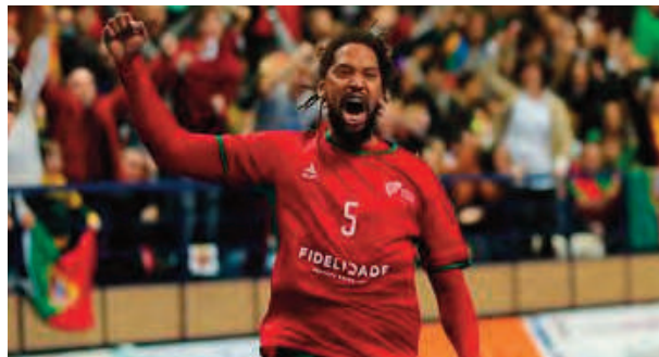
Seleção nacional defrontou polacos na Póvoa de Varzim

Numa partida em que a equipa lusa só precisava da igualdade, face à melhor diferença de golos em relação aos