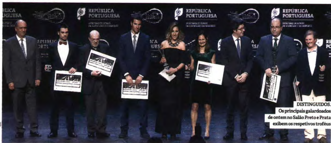
DISTINGUIDOS. Os principais galardoados de ontem no Salão Preto e Prata exibem os respetivos troféus