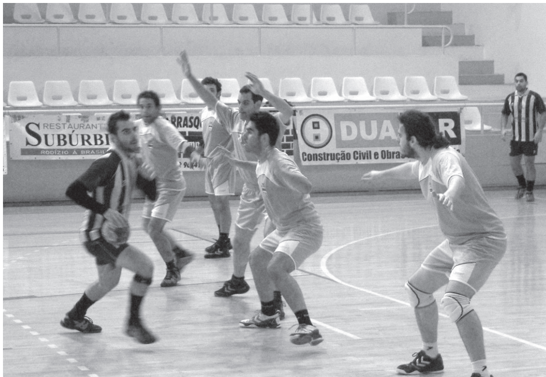
Durante os primeiros trinta minutos as equipas teimavam em não descolar do seu adversário