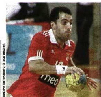
RUI PINTO FERNANDES / GLOBAL IMAGES