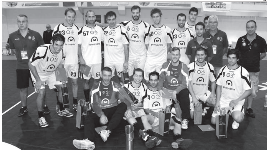
ABC/UMinho bateu Benfica na final da prova

A primeira parte foi marcada por um claro domínio do Benfica que, por diversas vezes, chegou a ter três golos de vantagem. O ABC reagiu bem, empatou a 10, mas permitiu, depois, que os encarnados fizessem um parcial de 3-0, que lhe proporcio-