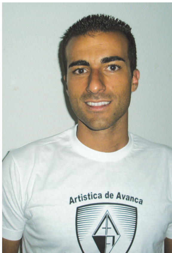
TREINADOR volta a testar a equipa frente ao ABC

ARTÍSTICA DE AVANCA CONTINUA A PREPARAR A SUA ESTREIA NA I DIVISÃO