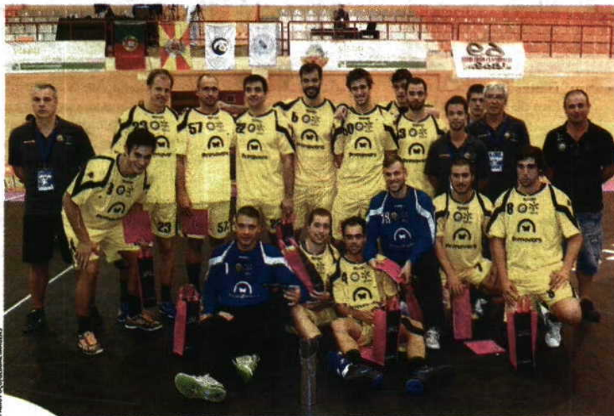
Festa » ABC sucede a Valholid e leva o troféu de 2012 para Braga

T erminou o período de testes. Vem aí a Supertaça, provas europeias e campeonato nacional. A partir de agora será a doer e ontem o ABC deixou uma mensagem clara, impondo-se ao Benfica (29-27) na final do Torneio Feira de São Mateus.