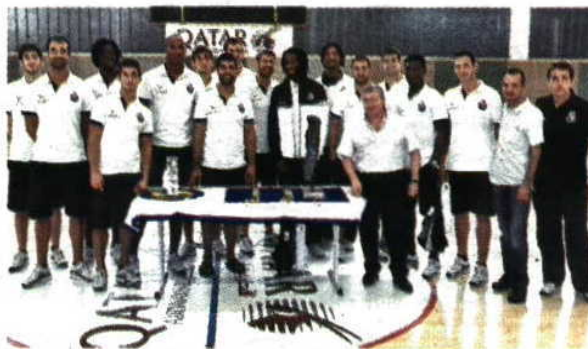
Vencedores > FC Porto e o troféu referente à vitória