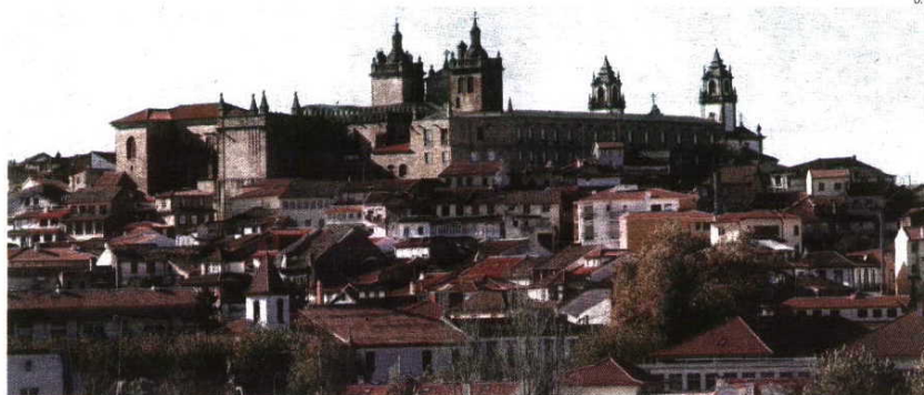
Viseu é o palco mais desejado quando falta uma semana para o arranque do campeonato

Em Viseu, o FC Porto ultima a qualificação para a fase de grupos da Liga dos Campeões, longe, por certo, das preocupações internas.