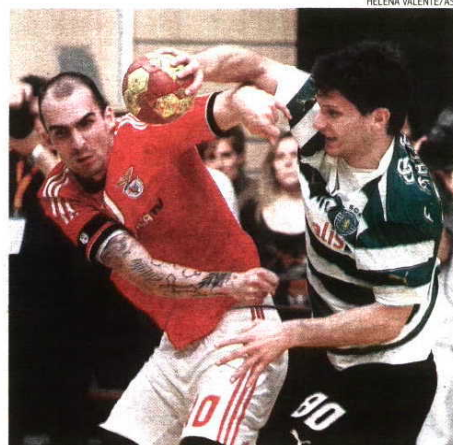
Benfica e Sporting defrontam-se, às 17 h, no pavilhão Cidade de Viseu