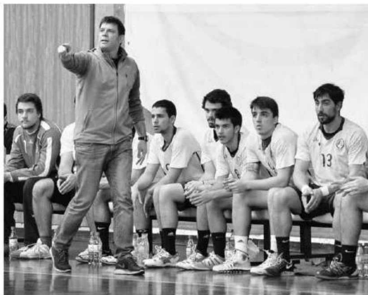
Madeirenses recebem o Benfica fragilizados, pelas 18h30.