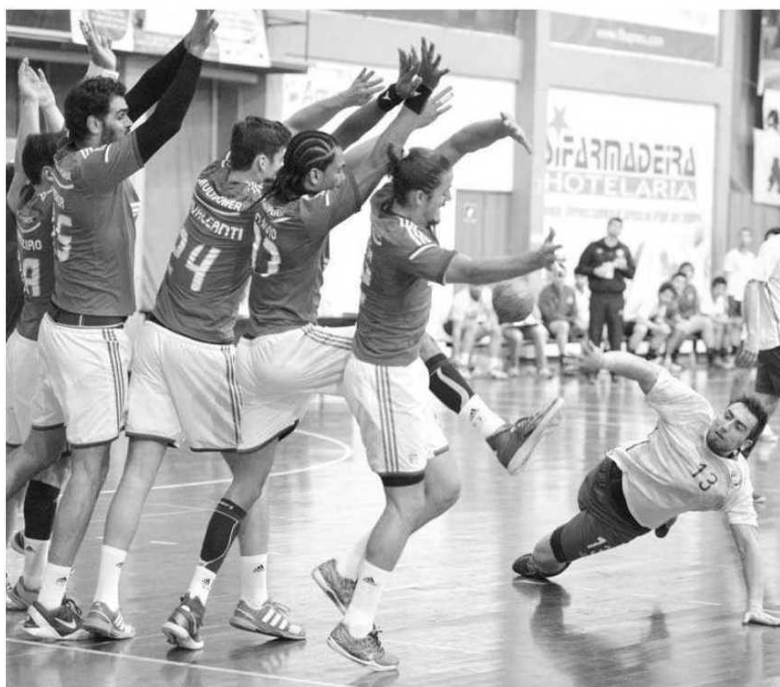
Madeira SAD empata no Funchal com o Benfica.

regular, o Madeira Andebol SAD vai a casa do Passos Manuel. O Águas Santas, actual 'dono' do quinto lugar, vai defrontar em Santo Tirso a equipa local e caso percam e os madeirenses vençam, caberá ao Madeira Andebol SAD terminar a fase regular num excelente quinto lugar, meta de certo modo impensável perante um quadro onde os madeirenses