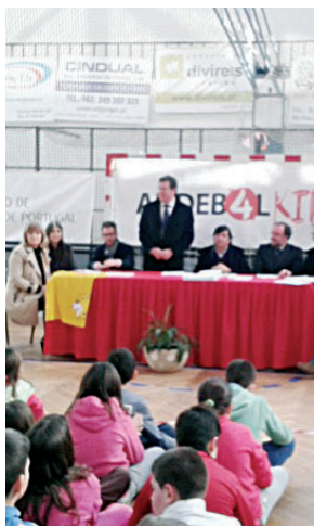
Assinatura do protocolo juntou várias instituições

Considerando que o elevado valor educativo do andebol (modalidade desportiva de grande implantação distrital e nacional) pode assumir um papel fundamental na formação