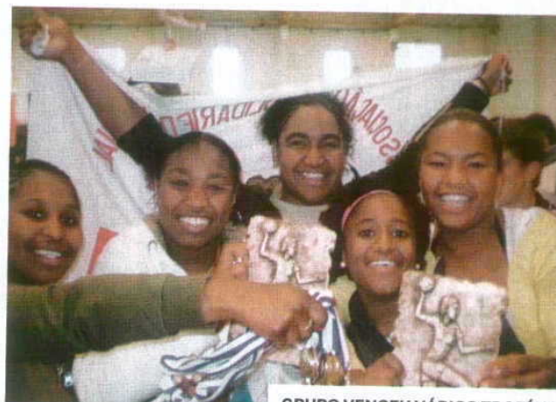
GRUPO VENCEU VÁRIOS TROFÉUS

participando em campeonatos a nível regional e nacional e, com os resultados alcançados, chegámos às competições europeias”, recorda.