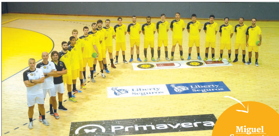
ABC/UMinho mantém a mesma ambição de sempre