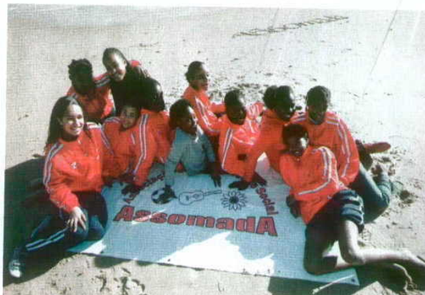
QUARTA GERAÇÃO DE ANDEBOL

Festivais de miniandebol animam três ilhas e promove-se o 1.º Encontro Nacional de Miniandebol