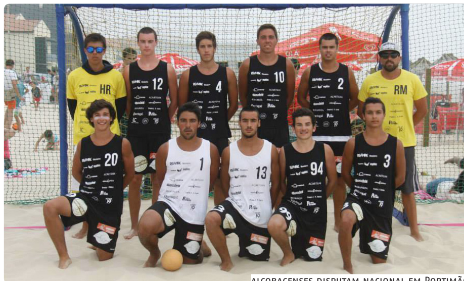
ALCOBACENSES DISPUTAM NACIONAL EM PORTIMÃO

A equipa Rubios, composta por jogadores do Cister Sport de Alcobça, fez o pleno de triunfos no circuito regional de andebol de praia no escalão de rookies masculinos, ao vencer a derradeira etapa na Praia do Pedrogão.