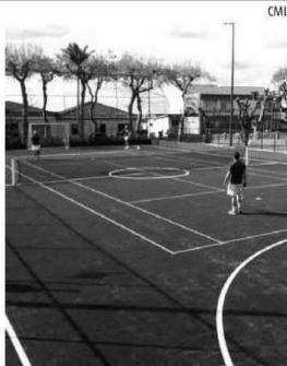
Polidesportivo do Rosário

“Esta é uma medida que visa, sobretudo, incrementar a prática do desporto como atividade de tempos livres, bem como dinamizar dois equipamentos desportivos que se encontram no centro urbano e que são muito procurados pela comunidade local, reforçando, similarmemente, uma política de desporto direcio-