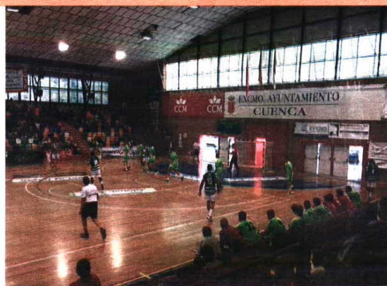
A equipa leonina liderada por Zupo foi a Espanha vencer o antigo clube do treinador

O ABC, por sua vez, viajou até ao Teucro para o primeiro desafio da época e perdeu por 30-31, mas contou apenas com 10 atletas para a partida com os espanhóis. Dio-