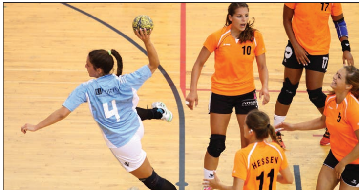
Equipa da Universidade do Porto em ação frente ao conjunto alemão

O europeu universitário de andebol que, está a decorrer em Braga teve ontem o seu dia "quase" livre, realizando-se apenas dois encontros no feminino. Num deles a Universidade do Porto venceu as alemãs da HfPV Wiesbaden e desta forma subiu ao primeiro lugar do grupo, embora com mais um