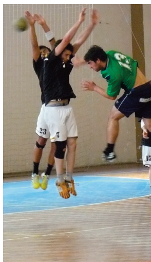
Juvenis do Sporting de Lamego em destaque

foi, na época passada, o 'bombo' da festa, mas este ano está a desforrar-se obtendo excelentes resultados e à sua frente na tabela classificativa só está o trio liderante. A experiência ganha na temporada anterior está a dar frutos e denota o trabalho importante