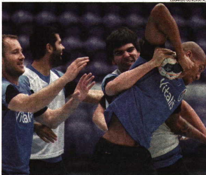
FC Porto prepara com empenho e animação a receção aos franceses do Dunkerque

Para já, esta experiência tem sido muito enriquecedora, explica o gigante guardião: «Senti diferenças no primeiro jogo, em termos de força e velocidade dos remates, mas temos de nos habituar e arranjar forma de os parar. Fizemos boas primeiras partes, com o Kielce e o Kiel,