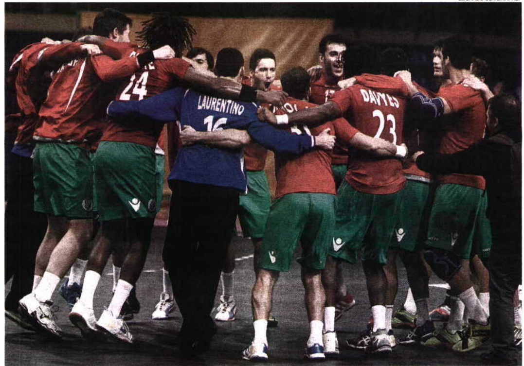
Vitória da Seleção Nacional por sete golos deixa Portugal no segundo lugar, que também qualifica para o Europeu da Dinamarca