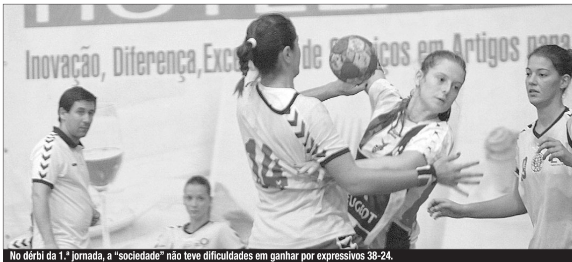
No dérbi da 1.ª jornada, a “sociedade” não teve dificuldades em ganhar por expressivos 38-24.