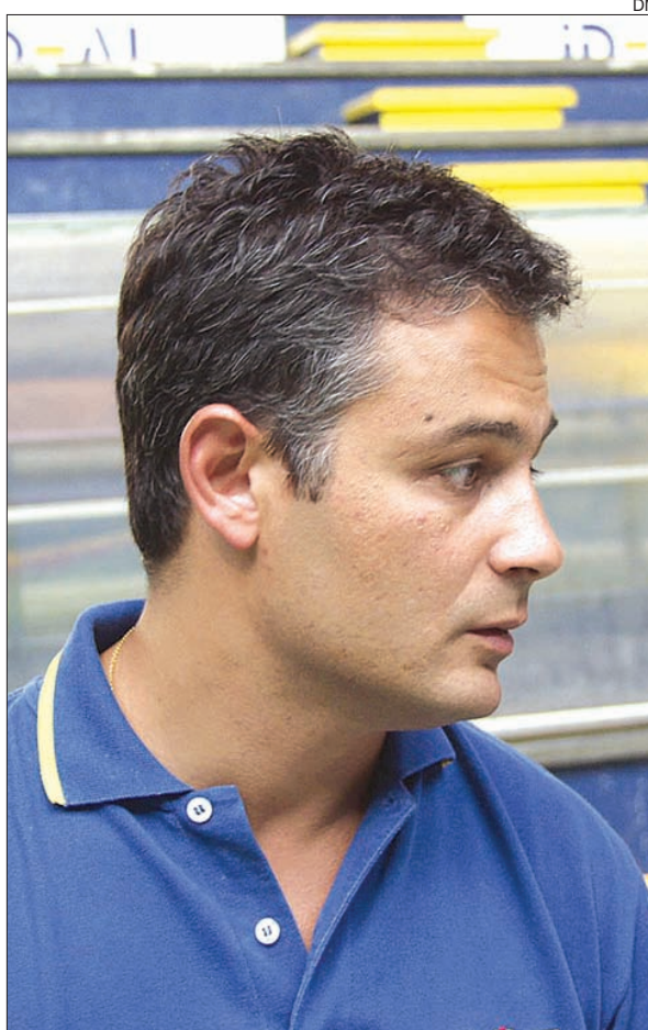
Rolando Freitas, selecionador nacional

A menos de 24 horas da partida frente à Macedónia, que se realiza hoje, na Nave Polivalente de Espinho (17h00, RTP 2), o selecionador nacional sente a equipa muito motivada. «Sabemos da relevância do jogo e sabemos também que, neste tipo de competição, os jogos em casa são fundamentais. Sinto a equipa mais descontraída, ainda mais alegre em termos do jogo que está a praticar e penso que é interessante que esta partida venha a seguir ao