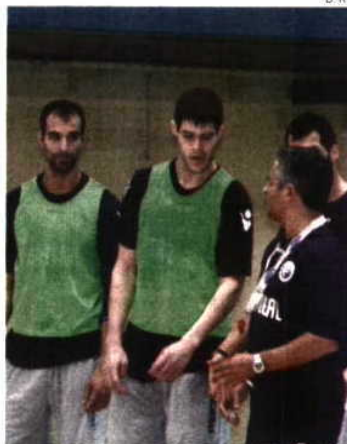
Portugal sem tempo para chorar