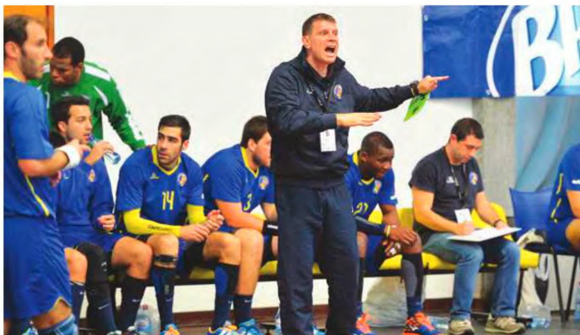
Madeira Andebol SAD está a um pequeno passo de voltar às competições europeias.