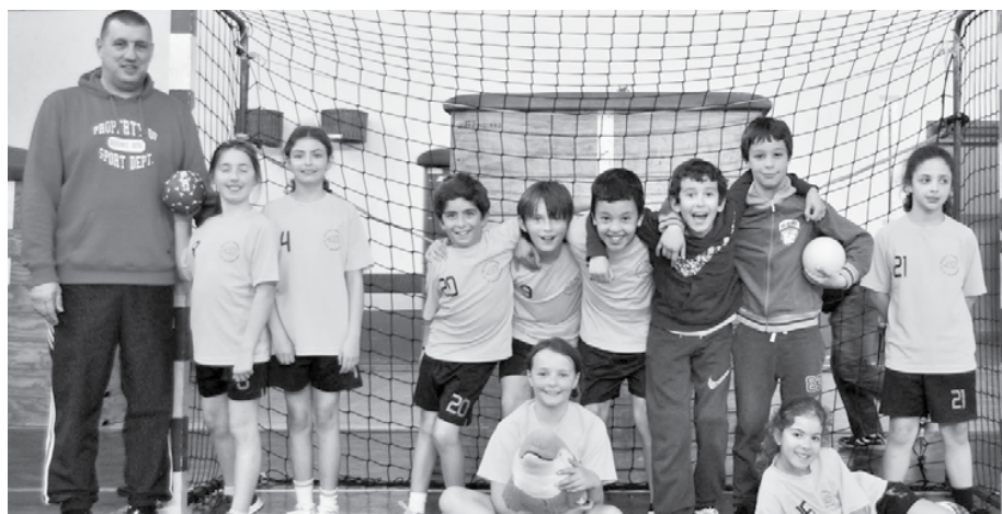
Equipa do Nadadouro

Realizou-se em Leiria, no passado dia 17, o segundo encontro de andebol da terceira fase de minis (masculinos e femininos) da Associação de Andebol de Leiria.