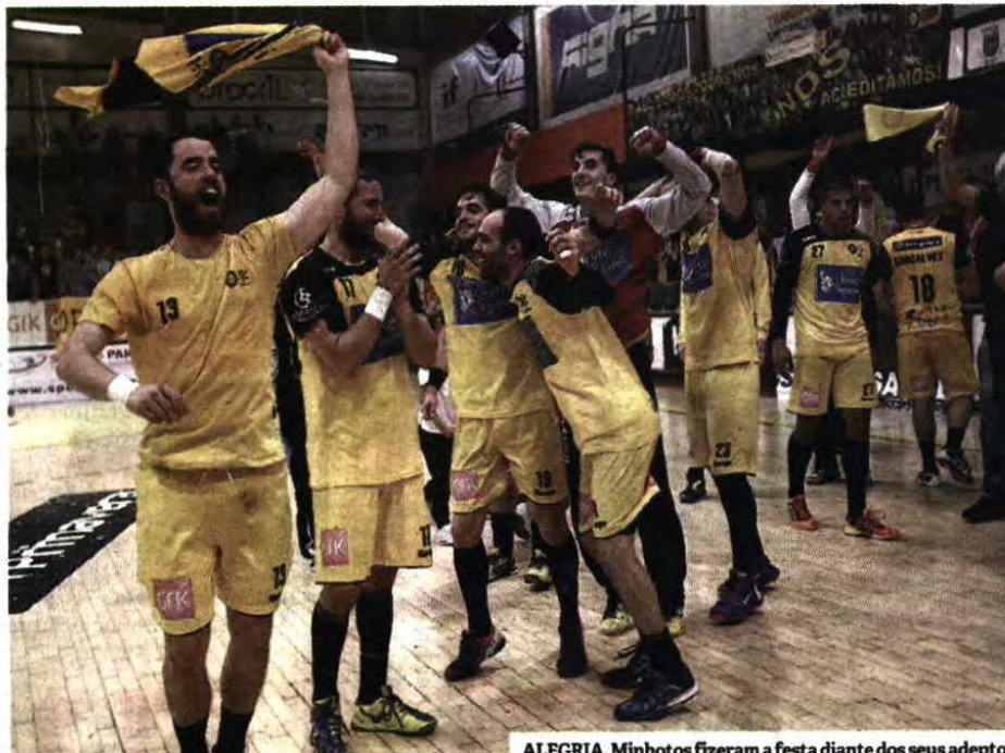
ALEGRIA. Minhotos fizeram a festa diante dos seus adeptos

No sector defensivo, a turma de Braga pressionava a primeira linha dos leões, muito perdulários com falhas técnicas e a permiti-