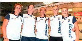
O CS Madeira iniciou ontem no Pavilhão do Funchal os trabalhos para a nova temporada, apresentando uma dos plantéis mais experientes e ambiciosos das últimas temporadas a que se juntam muitas jovens.

HERBERTO D. PEREIRA desporto@dnoticias.pt