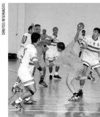
Marienses estão em último lugar

No próximo domingo, os Marienses recebem o ADC Benavente. ♦ SR