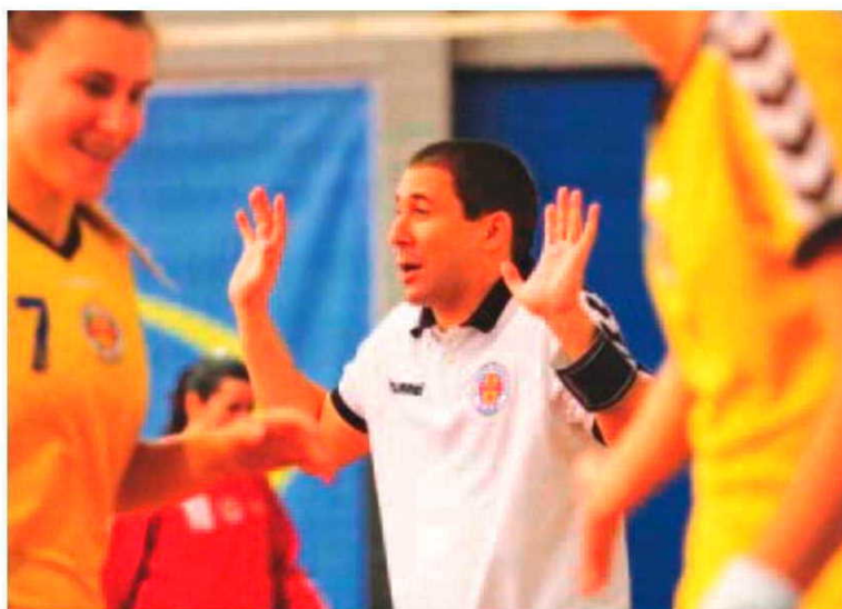
Madeira SAD defronta Académico FC para a Taça de Portugal.

Já os masculinos lutam pela terceira fase do Nacional da I divisão, também nas mesmas datas tendo como adversários as equipas do Ginásio do Sul, Sp. da Horta e Estarreja. Os dois primeiros passam à quarta fase da prova. P. V. L.