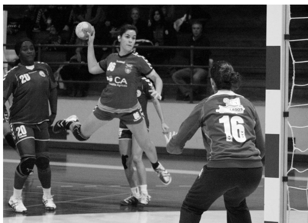
EQUIPA de Meirinhas está em terceiro lugar à frente da Juve Lis