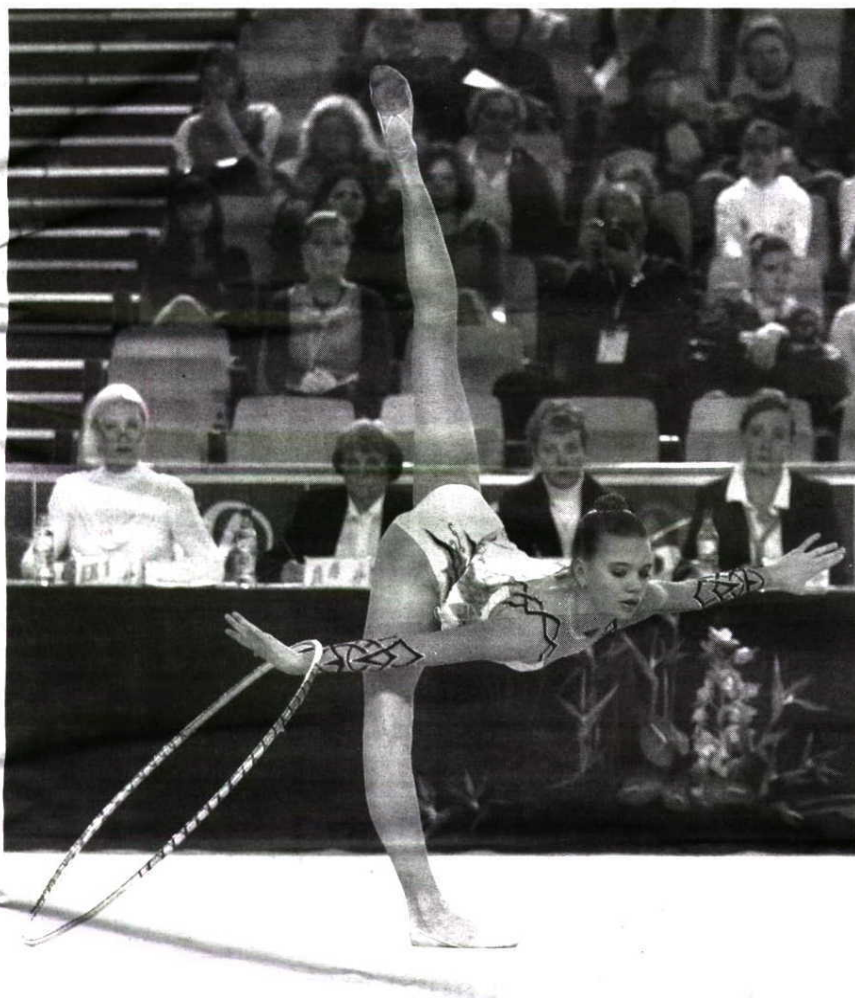
É o movimento associativo, os grandes eventos e o transporte aéreo que vão sofrer mais cortes.

de reduzir perto de um milhar de passagens com as medidas que anunciou.