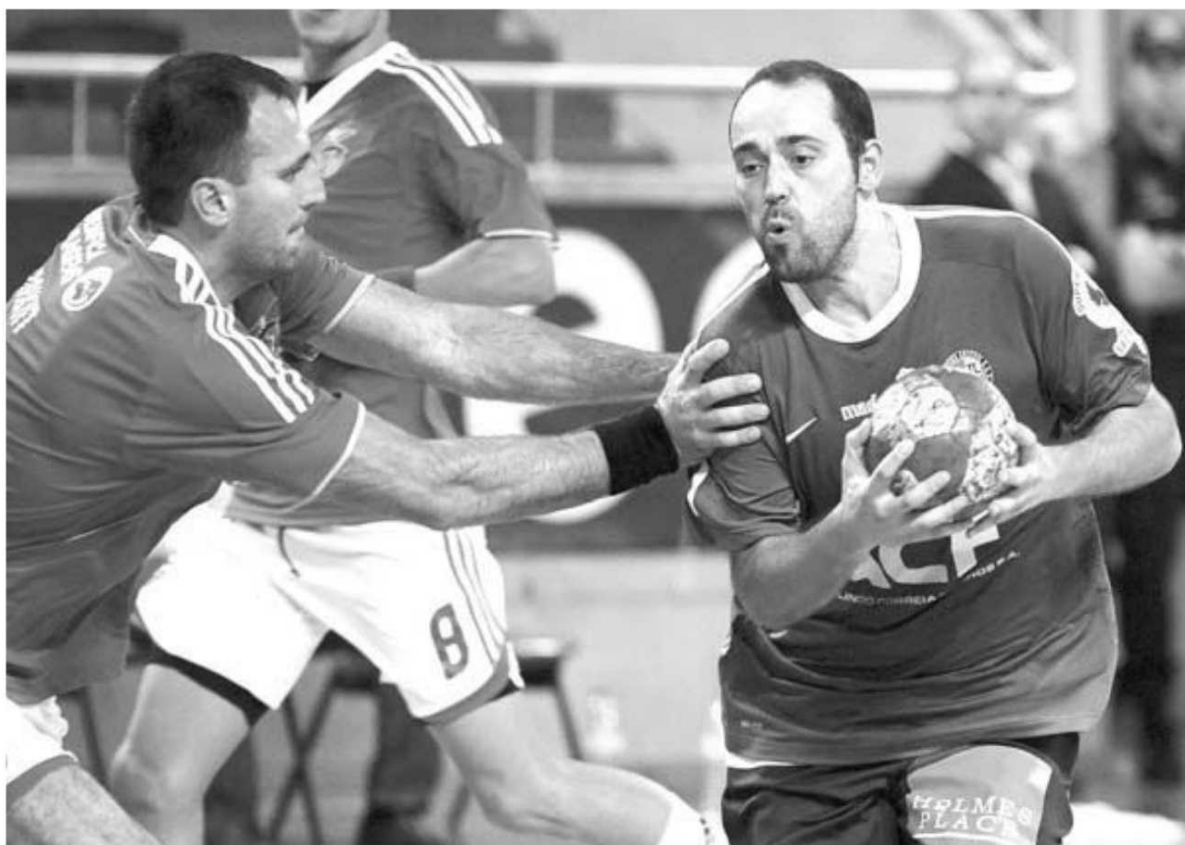
Os madeirenses iniciaram com uma excelente vitória na Luz um ciclo de jogos complicados.