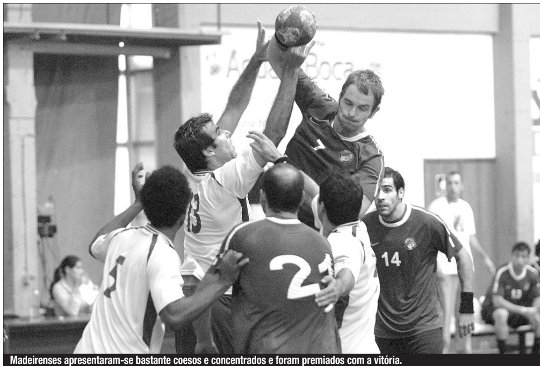
Madeirenses apresentaram-se bastante coesos e concentrados e foram premiados com a vitória.

■ AS MADEIRENSES INFLINGEM PRIMEIRA DERROTA DA ÉPOCA AO BENFICA