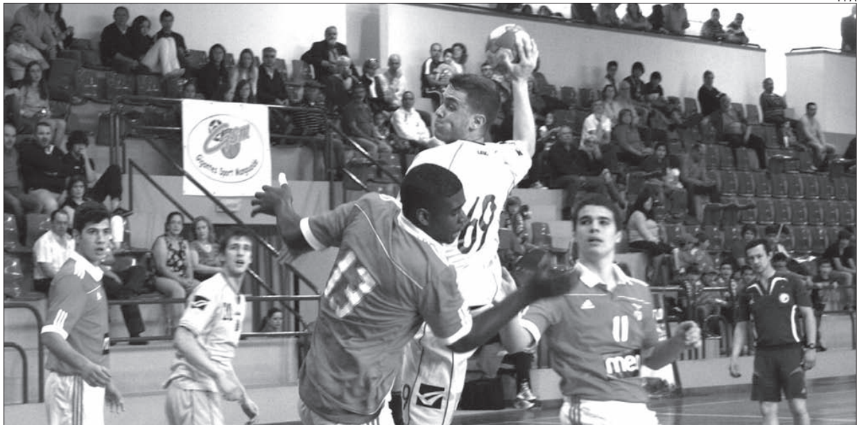
Turma academista bateu encarnados na terceira e última ronda da prova, assegurando o terceiro lugar