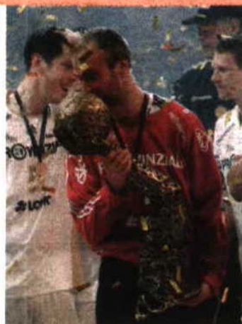
Guarda-redes Thierry Omeyer beija troféu

Depois, a perder por 9-7 aos 21 minutos, os alemães dispararam um parcial de 6-0 até aos 13-9, sem nunca mais perderem a liderança do marcador, assente nos dois laterais, Kim Andersson e Filip Jicha, autores de sete e seis golos, respetivamente.