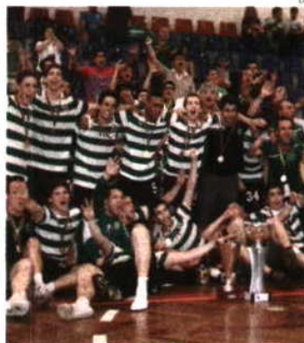
Sporting voltou a fazer a festa em juniores