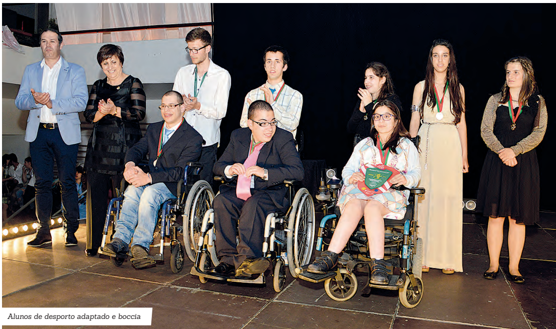
Alunos de desporto adaptado e boccia