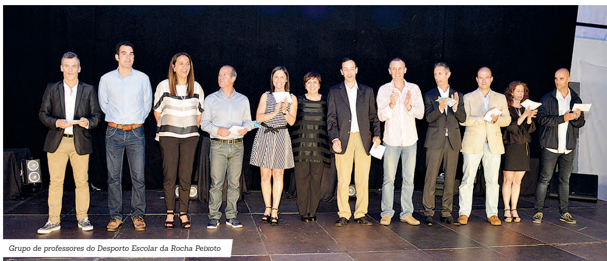
Grupo de professores do Desporto Escolar da Rocha Peixoto