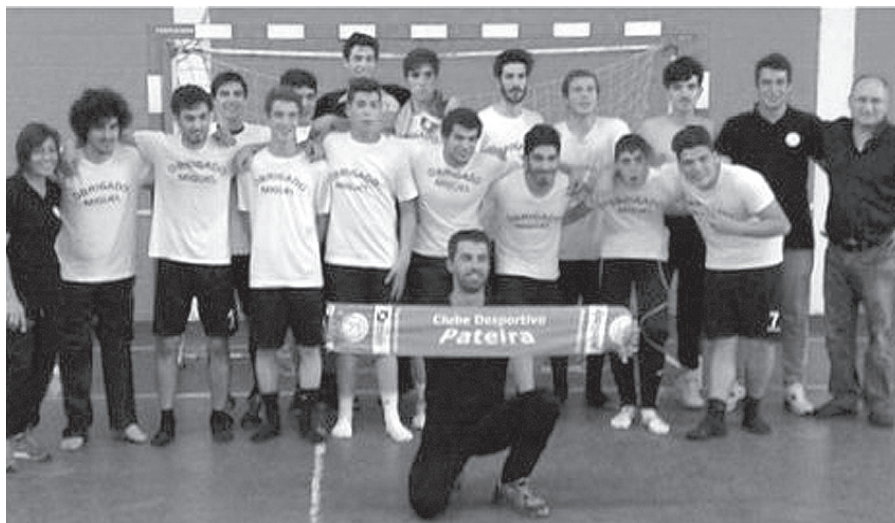
▲ Juvenis masculinos do CD Pateira