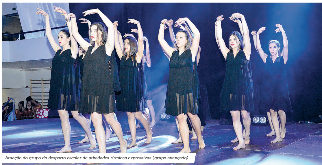
Atuação do grupo do desporto escolar de atividades rítmicas expressivas (grupo avançado)