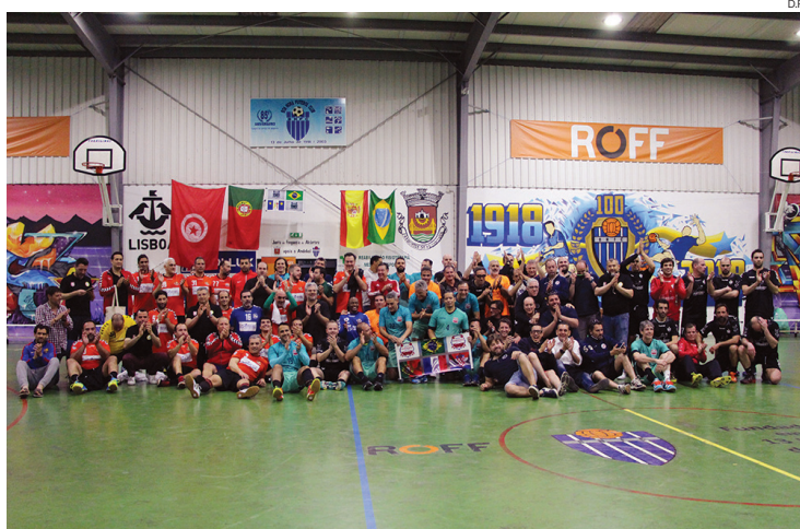
Grupo de jogadores veteranos das seis equipas que competiram em Lisboa

A Esferantástica ACD, a equipa anfitriã do torneio, terminou em segundo lugar, enquanto o Recife HM ficou na terceira posi-