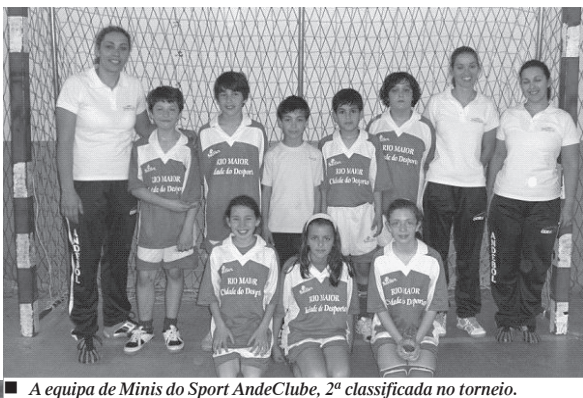
■ A equipa de Minis do Sport AndeClube, 2ª classificada no torneio.

A equipa de Minis do AndeClube realizou onze jogos, tendo con-