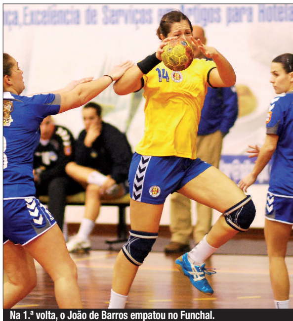
Na 1.ª volta, o João de Barros empatou no Funchal.