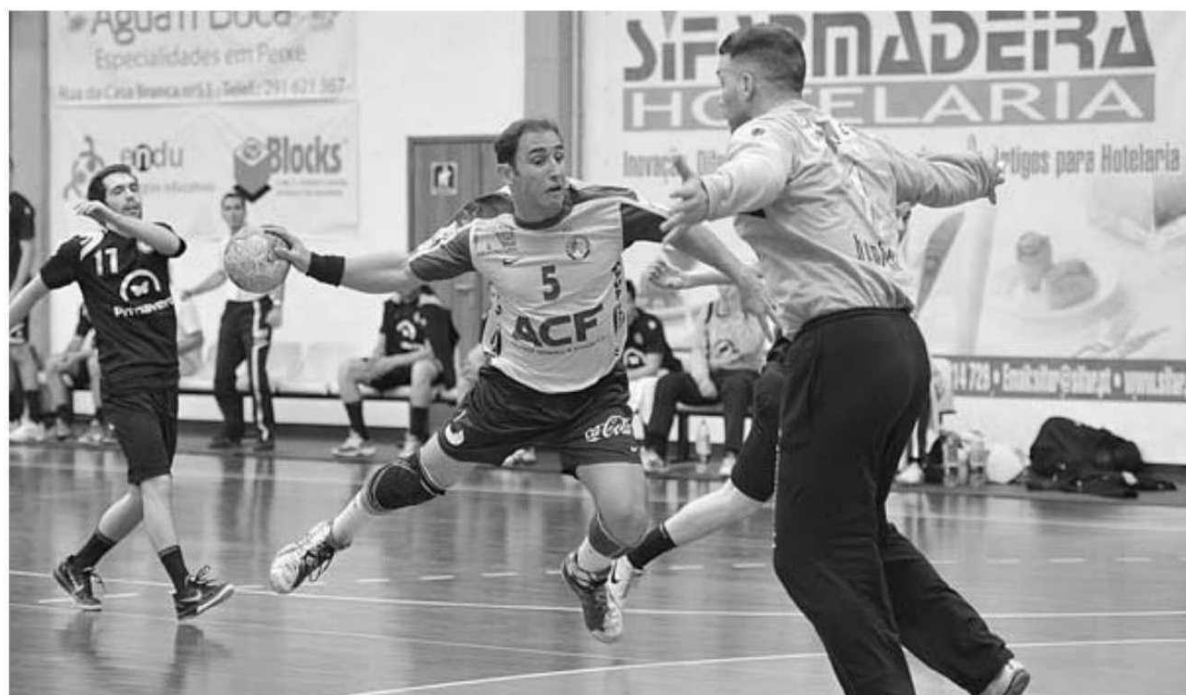
Os madeirenses tiveram tudo para vencer o ABC, mas cederam no final.