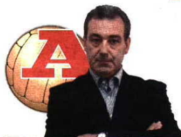
POR JOSÉ MANUEL DELGADO

Apesar da intemperie e da falta de 'grandes objectivos', mais de 31 mil sportinguistas viram, em Alvalade o Portimonense. Porquê?