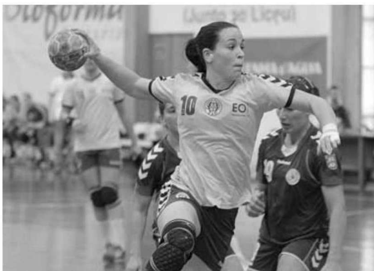
Madeira Andebol SAD venceu bem no reduto do João Barros