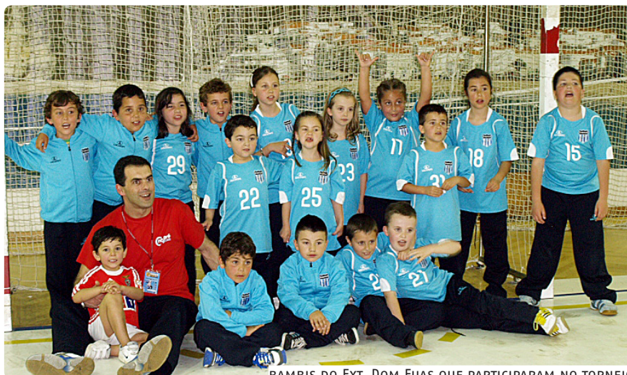
BAMBIS DO EXT. DOM FUAS QUE PARTICIPARAM NO TORNEIO

Terminou em festa a 24. a edição do NazaréCup, torneio internacional de andebol jovem que reuniu na vila mais de um milhar de atletas, em representação de 61 equipas nacionais, espanholas, francesas e polacas.