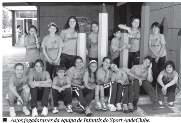
■ As/os jogadoras/es da equipa de Infantis do Sport AndeClube.