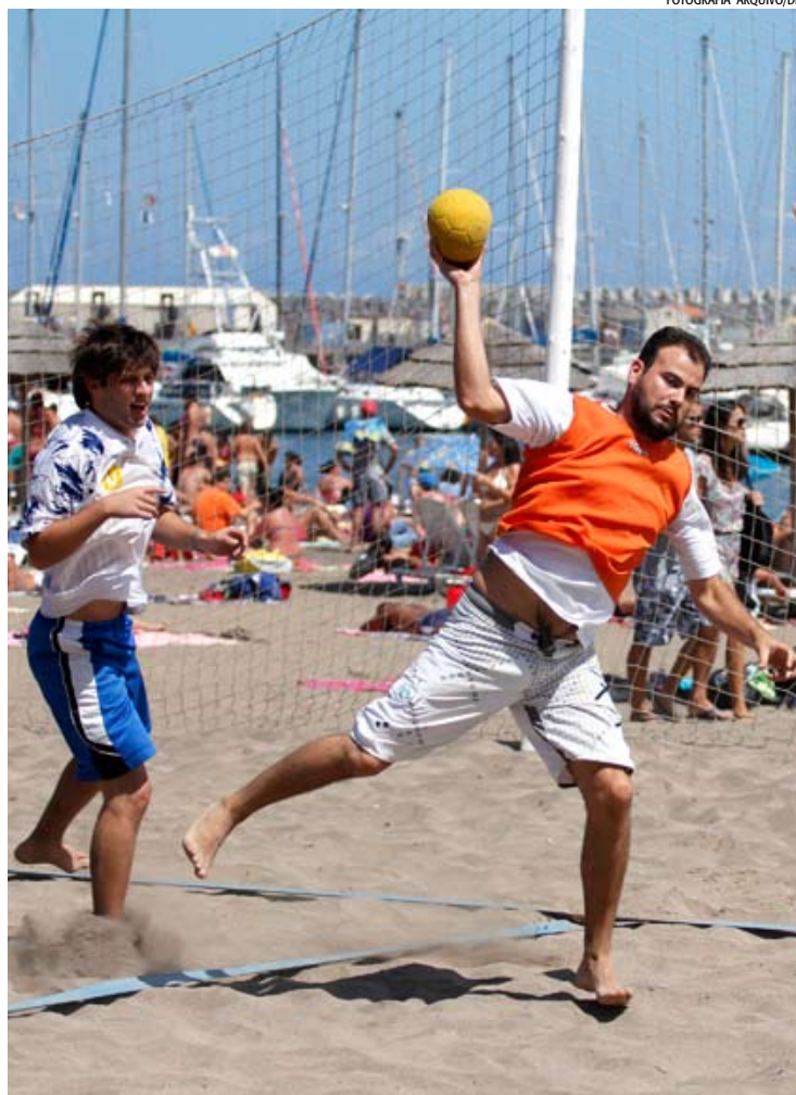
ANDEBOL DE PRAIA anima festas do concelho de Vitorino Nemésio