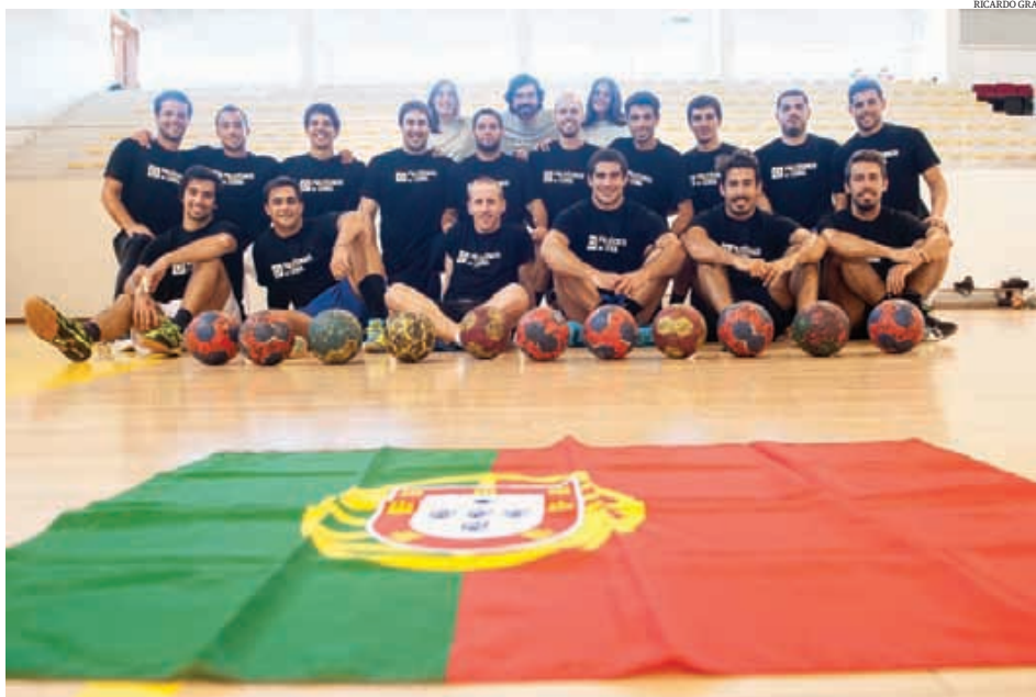
Equipa de andebol de Leiria quer honrar a cidade, mas também o País

Equipa masculina participa pela primeira vez no evento