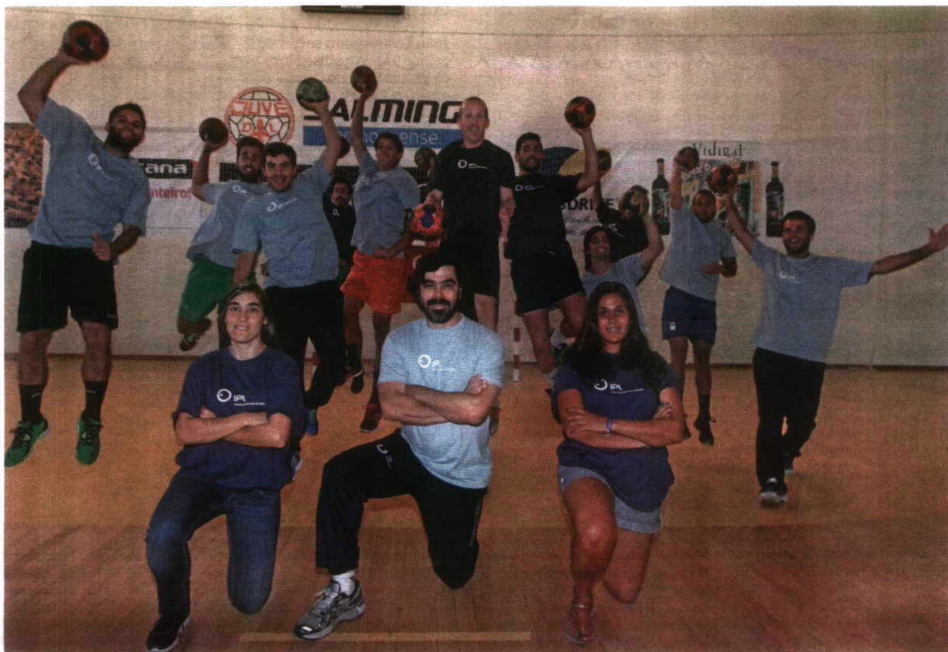
Motivação e boa disposição na formação de Leiria que vai representar Portugal no Europeu em Braga