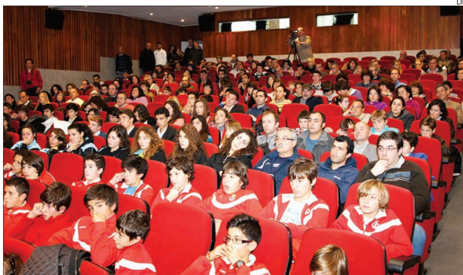
Auditório de Esposende encheu com a gala do desporto

Foram distinguidos 42 atletas, 11 técnicos, 4 equipas e 7 associações desportivas do concelho, numa cerimónia onde foram também assinados os Contratos Programa de Desenvolvimento Desportivo entre o Município de Esposende e a Federação Portuguesa de Canoagem, Federação Portuguesa de Taekwondo, Associação de Patinagem do Minho, Associação de Andebol de Braga e Associação de Futebol de Braga.