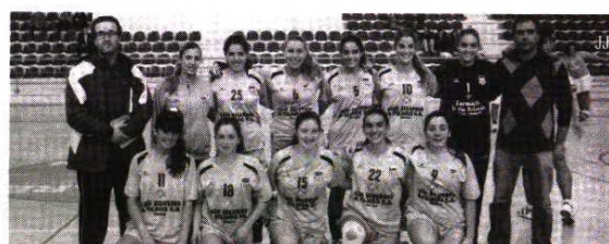
Juvenis B femininos do Dom Fuas Roupinho golearam na passada

Magos onde derrotaram a turma local (19-29). Por sua vez o Cister SA, recebeu e perdeu em casa com o Estarreja AC, (27-41).