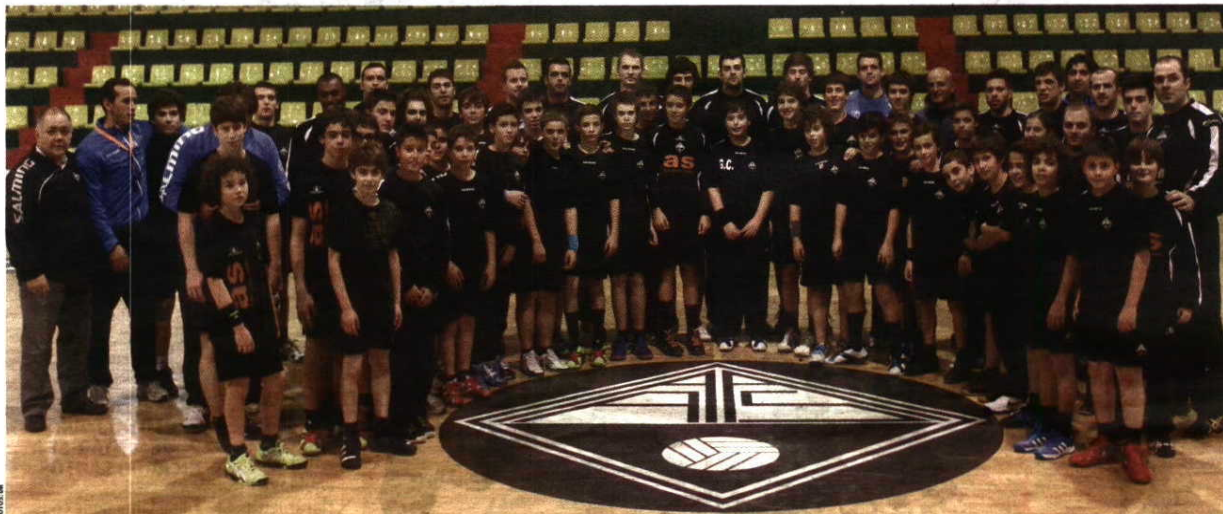
Orgulho > Com os seniores por trás, as equipas de Infantis e Iniciados que foram campeãs no ano passado