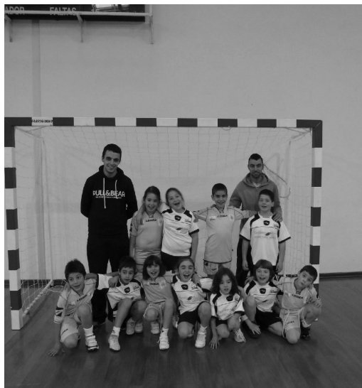
EQUIPA DE BAMBIS do S. Miguel do Mato