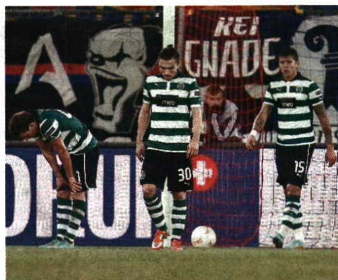
Frágil > Em 18 jogos, o Sporting sofreu 24 golos

Passado o mesmo número de jogos que levou à saída do primeiro treinador da temporada, nove, os sucessores Oceano Cruz (interino em quatro jogos) e Franky Vercauteren deixaram a equipa a 15 pontos da liderança da Liga e a seis do terceiro lugar. Além disso, a equipa foi eliminada da Taça de Portugal e da Liga Europa. Só o terceiro lugar no campeonato parece possível – ea Taça da Liga ainda não começou.