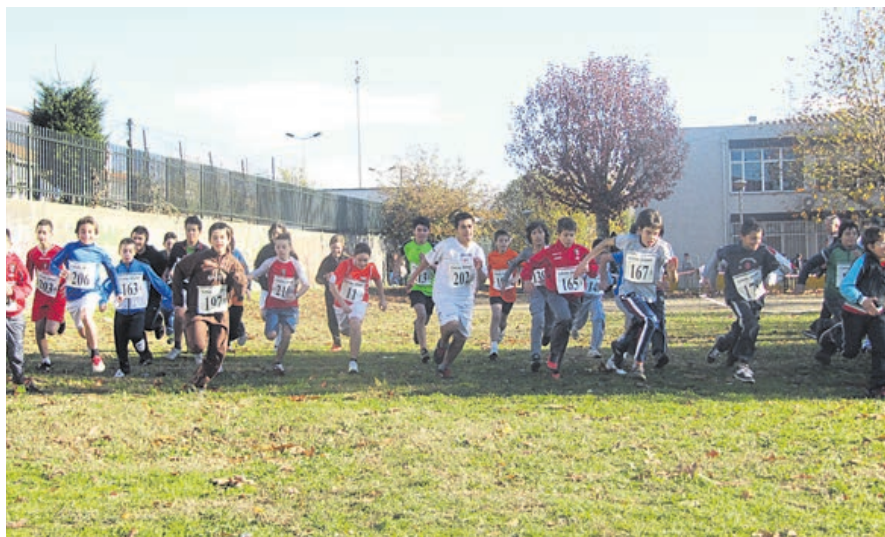
Momento de uma prova masculina no recinto da Escola EB 2,3 D. Frei Caetano Brandão

Na prova de ontem destaca-se ainda o apoio da Associação de Pais do Agrupamento Escolas de Maximinos, que distribuiu lanche pelos participantes.