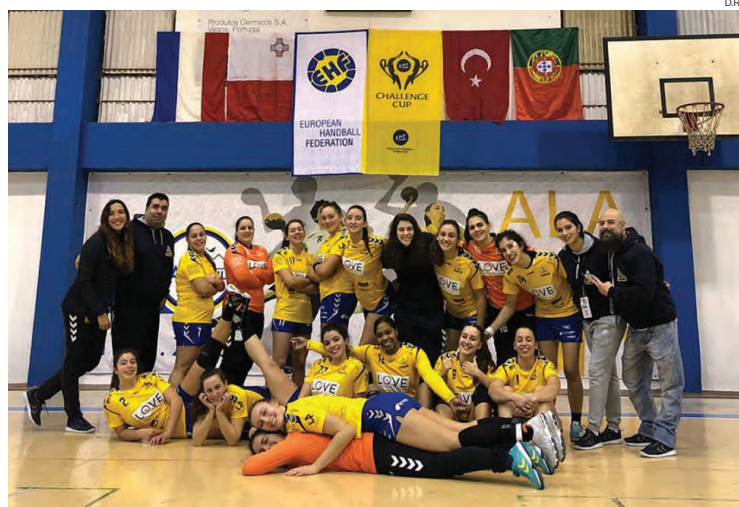
A equipa do Alavarium Love Tiles tem hoje um jogo complicado na Turquia

"Acima de tudo queremos dignificar o clube e continuarmos a crescer como equipa, para entrarmos na parte decisiva do campeonato na máxima força e também ultrapassar a próxima ronda da Taça de Portugal para chegarmos à Final Four", sustenta o técnico do Alavarium Love Tiles, que entra em acção no M.Y.O. Kapali Erdogan University a partir das 15 horas portuguesas (18 horas locais), num jogo que será dirigido por Sherif Xhe-ma/Besfort Jahja, dupla de árbitros do Kosovo. ◀