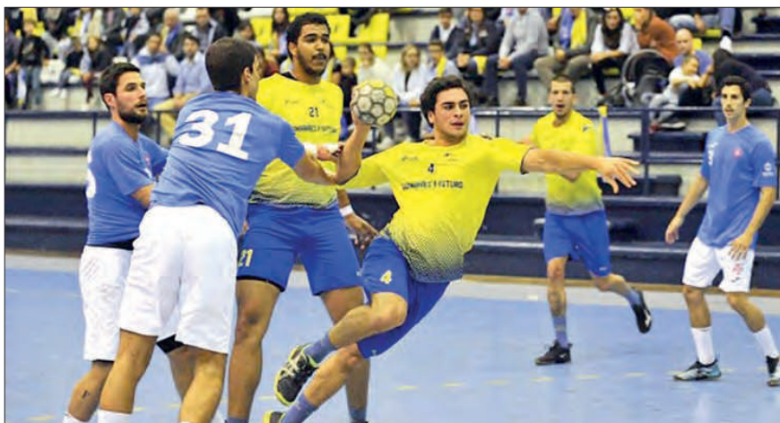
CD Xico Andebol, aqui em ação com Belenenses, recebe o AC Fafe

A ronda arrancou com o Benfica, fora, a vencer o Boa Hora (35-32).