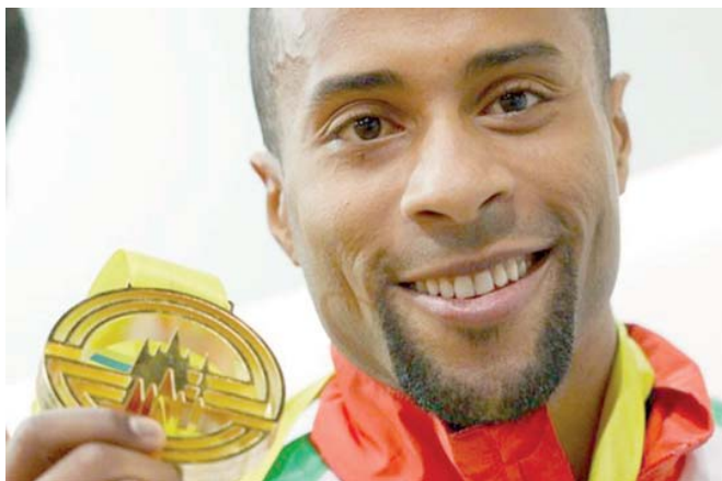
Nelson Évora, uma das grandes esperanças da Selecção Nacional em Pequim

Ainda assim, o trio inicialmente referido está, certamente, no topo. O saltador, cujos últimos anos têm sido marcados por um “calvário” de lesões que aparentava não ter fim,