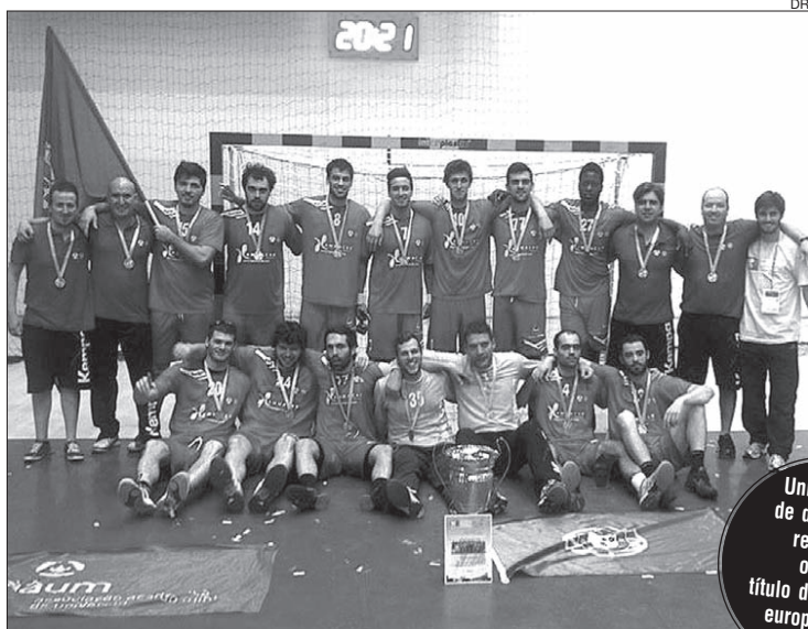
Os campeões europeus

A Universidade do Minho sagrou-se novamente campeã europeia universitária de andebol depois de na final do 7.º campeonato europeu universitário de andebol, que decorreu em Katowice (Polónia), ter batido por 32-21 a University J.J.Strossmayera Osijek (Croácia).