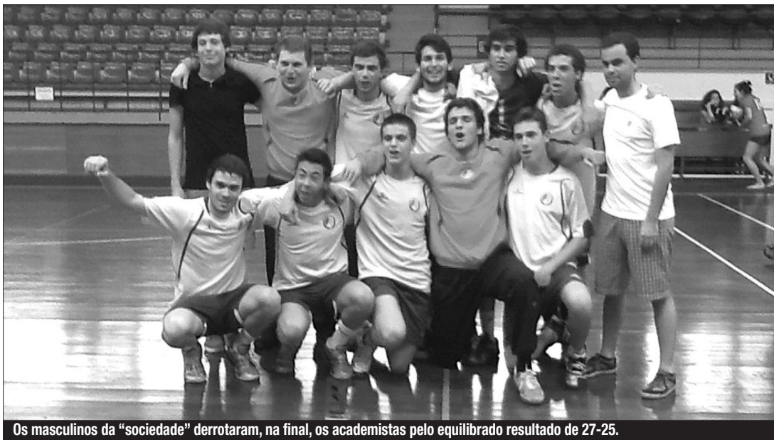
Os masculinos da "sociedade" derrotaram, na final, os academistas pelo equilibrado resultado de 27-25.

■ ANDEBOL - 29.º TORNEIO "MADEIRA HANDBALL" PELO ACADÉMICO DO FUNCHAL