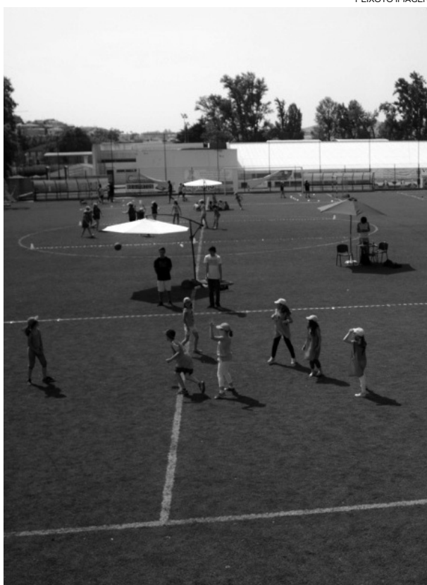
Campo 1.º de Maio acolheu festa da secção de andebol

Além da entrega dos atletas a todos os níveis, foi um Festand bem organizado. A preparação, organização dos jogos, estações com actividades, circuitos gímnicos e de perícias motoras com bola, 5 campos de mini andebol, sistema de som, espaços amplos, água, alimentação, etc., foi um trabalho elogiado por todas as pessoas envolvidas. Foi, sem dúvida, um convívio com muita alegria e boa disposição.