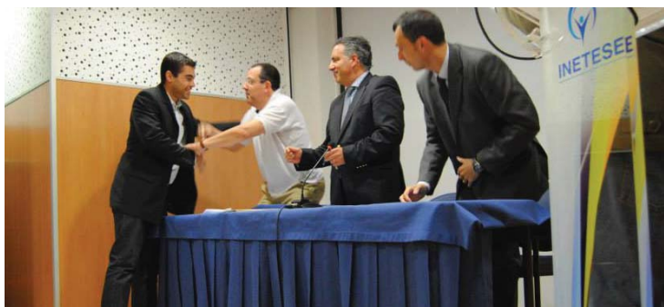
Passagem de testemunho na Associação de Andebol de Castelo Branco

Voltar a ter Castelo Branco na ribalta da modalidade