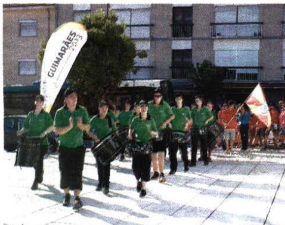
Convívio > Os Jogos contam com 1300 atletas inscritos

Além dos 1300 atletas, mais 200 técnicos e "staff" participaram nesta edição dos Jogos