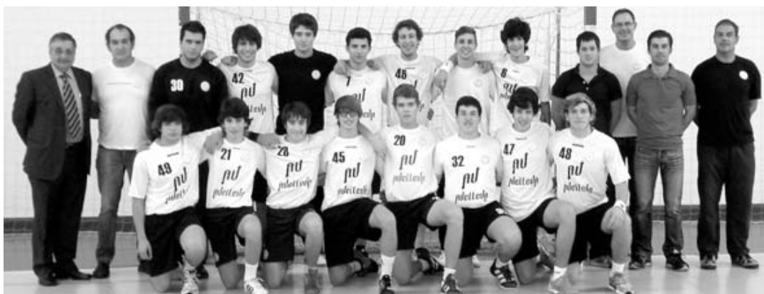
Juvenis masculinos do CD Pateira