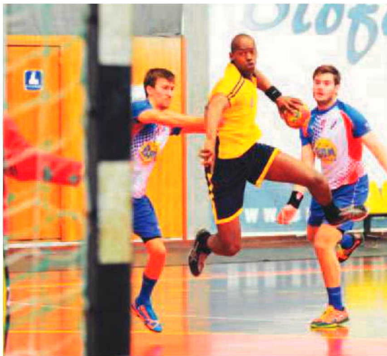
O Madeira Andebol SAD não conseguiu vencer.

Frente ao Sporting da Horta, num encontro que marcou o início da 2ª volta da competição, o Madeira Andebol SAD tinha pela frente um adversário directo na luta por um lugar entre os seis primeiros classificados, pelo que a obtenção de um resultado positivo daria um alento a este projecto. Porém, a técnica Sandra Fernandes não teve a possibilidade de poder contar