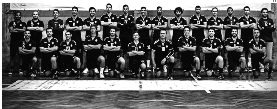
A Sanjoanense, frente ao Santo Tirso, não teve a estreia que certamente desejava